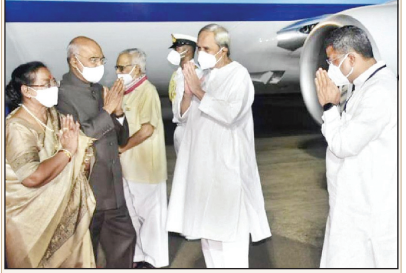
ଭୁବନେଶ୍ୱର ବିମାନବନ୍ଦରରେ ରାଷ୍ଟ୍ରପତି ରାମକୋବିନ୍ଦ ଓ ପତ୍ନୀ ସବିତା କୋବିନ୍ଦଙ୍କୁ ସ୍ୱାଗତ ଜଣାଇଛନ୍ତି ରାଜ୍ୟପାଳ ପ୍ରଫେସର ଗଣେଶ ଲାଲ, ମୁଖ୍ୟମନ୍ତ୍ରୀ ନବୀନ ପଟ୍ଟନାୟକ ଓ କେନ୍ଦ୍ରମନ୍ତ୍ରୀ ଧର୍ମେନ୍ଦ୍ର ପ୍ରଧାନ ।