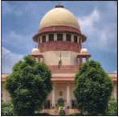
ଜୀବଙ୍କ ପ୍ରସଙ୍ଗ ଉଠାଇଥିଲେ। ମାତ୍ର ସିବଲ କହିଥିଲେ ଯେ ମୁଁ ତିକେନ ଖାଇବା ବନ୍ଦ କରିଦେଇଛି। କାରଣ କୁକୁଡ଼ାଗୁଡ଼ିକୁ ନିଷ୍ଠୁର ଭାବେ

ସେତିକି ଦରଦ ଦେଖାଯାଉ ନାହିଁ। ଦେଶରେ ଦୈନିକ ଲକ୍ଷ ଲକ୍ଷ ଛେଳି ଓ କୁକୁଡ଼ା ହତ୍ୟା କରାଯାଉଛି। ଏହି ଜୀବଗୁଡ଼ିକଙ୍କର କ'ଣ ଜୀବନ ନାହିଁ। ସେଥିପ୍ରତି କାହିଁକି କେହି କିଛି କରୁ ନାହାନ୍ତି। ଏହି ପ୍ରସଙ୍ଗରେ ଜଣେ ଆବେଦନକାରୀଙ୍କ ପକ୍ଷରୁ ଉପସ୍ଥୁତ ଥିବା ବରିଷ୍ଠ ଓକିଲ କପିଳ ସିବଲ କହିଥିଲେ ଯେ କୁକୁର ପ୍ରେମୀମାନେ ହେଉଛନ୍ତି ଏକ ପ୍ରକାର ପରିବେଶ ପ୍ରେମୀ। ତେଣୁ ସେମାନେ ପରିବେଶ ସୁରକ୍ଷା ଉଦ୍ଦେଶ୍ୟରେ କୁକୁରଙ୍କୁ ସୁରକ୍ଷା ଦାବି କରୁଛନ୍ତି। ଆମ ପରିବେଶ ଏକ ଶୁଖିଲାରେ ବନ୍ଧା ହୋଇଛି। ଗୋଟିଏ ଶୁଖିଲା ଛିଣ୍ଡିଗଲେ ପୁରା ବ୍ୟବସ୍ଥା ବିଚିତ୍ରଯିବ। ସିବଲଙ୍କ ଏପରି ଯୁକ୍ତି ପରେ ସୁପ୍ରିମକୋର୍ଟ ଛେଳି ଓ କୁକୁଡ଼ାଙ୍କ ଭଳି ଅନ୍ୟ