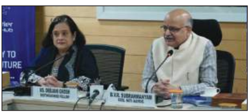
କରିଥିଲେ। ବୈଷୟିକ ଉନ୍ନତି କ୍ଷେତ୍ରରେ ଭାରତକୁ ଅଗ୍ରଣୀ ସ୍ଥାନରେ ରଖିବା ପାଇଁ ଗବେଷଣା, ଉତ୍ତରଣ ଏବଂ ବୈଷୟିକ ଭାରିଦାଦା କ୍ଷେତ୍ରରେ ରଣନୈତିକ ପୁଞ୍ଜିନିବେଶ ଗୁରୁତ୍ୱପୂର୍ଣ୍ଣ ହେବ ବୋଲି ସେ କହିଛନ୍ତି।