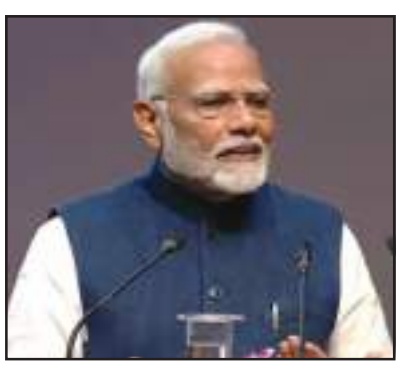
ଦେଶର ମୁଖ୍ୟଙ୍କ ମଧ୍ୟରେ ଦ୍ୱିପାକ୍ଷିକ ପ୍ରସଙ୍ଗ ଉପରେ ଆଲୋଚନା ହେବାର ସମ୍ଭାବନା ରହିଛି। ଆମେ କହି ରଖୁଛୁ ଯେ ଡିସେମ୍ବର ୨୦୨୪ରେ, ଶ୍ରୀଲଙ୍କା ରାଷ୍ଟ୍ରପତି ଦିସାନାୟକେ ତିନି ଦିନିଆ

ନୂଆଦିଲ୍ଲୀ : ପ୍ରଧାନମନ୍ତ୍ରୀ ନରେନ୍ଦ୍ର ମୋଦୀ ଏପ୍ରିଲ ପ୍ରଥମ ସପ୍ତାହରେ ଶ୍ରୀଲଙ୍କା ଗସ୍ତ କରି ପାରନ୍ତି। ପୂର୍ବରୁ, ପ୍ରଧାନମନ୍ତ୍ରୀ ମୋଦୀଙ୍କୁ ଶ୍ରୀଲଙ୍କା ରାଷ୍ଟ୍ରପତି ଅନୁରା କୁମାର ଦିସାନାୟକେ ନିମନ୍ତ୍ରଣ କରିଥିଲେ। ପ୍ରଧାନମନ୍ତ୍ରୀ ମୋଦୀଙ୍କ ଏହି ଗସ୍ତ ଭାରତ ଏବଂ ଶ୍ରୀଲଙ୍କା ମଧ୍ୟରେ ଦ୍ୱିପାକ୍ଷିକ ସମ୍ପର୍କକୁ ମଜବୁତ କରିବ। ପୂର୍ବରୁ, ବିମୁକ୍ତଶିଖର ସମ୍ମିଳନୀ ୨ ରୁ ୪ ଏପ୍ରିଲ ପର୍ଯ୍ୟନ୍ତ ବ୍ୟାଙ୍କକରେ ଆୟୋଜିତ ହେଉଛି, ଯେଉଁଥିରେ ପ୍ରଧାନମନ୍ତ୍ରୀ ମୋଦୀ ଅଂଶଗ୍ରହଣ କରିବେ। ଏହା ପରେ ପ୍ରଧାନମନ୍ତ୍ରୀ ନରେନ୍ଦ୍ର ମୋଦୀ ଶ୍ରୀଲଙ୍କା ଯାଇପାରନ୍ତି ବୋଲି ବିଶ୍ୱାସ କରାଯାଉଛି। ଏହି ସମୟ ମଧ୍ୟରେ ଦୁଇ