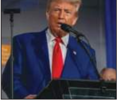
କାଲାଲିଙ୍କ ସହ ଇରାନର ପରମାଣୁ କାର୍ଯ୍ୟକୁ ପ୍ରମାଣ ପରିସ୍ଥିତିର ସମାଧାନ ପାଇଁ ଅନ୍ତର୍ଜାତୀୟ ପ୍ରମାଣ ବିଷୟରେ ଆଲୋଚନା କରିଛନ୍ତି। କାହାଣୀରେ ରାଷ୍ଟ୍ରପତି ଭାବେ ଦାୟିତ୍ୱ ଗ୍ରହଣ କରିବା ପରେ ଟ୍ରମ୍ପ ଆମେରିକାର ଦୈନିକିକ ରୂପ ପ୍ରତି ଆମେରିକାର ଆର୍ଥିକ ବଦଳିଯାଇଛି ଏବଂ ଅଧିକ ବ୍ୟୟାବହାର ଆର୍ଥିକ ସମ୍ପର୍କ ଗଢ଼ାଇଛି। ଏହା ଅନ୍ୟ ପାଖାପାଖି ସହଯୋଗୀକ ମଧ୍ୟରେ ତିନା ବଢ଼ାଇଛି। ରୁଷ୍ ଓ ଯୁକ୍ତେନ ମଧ୍ୟରେ ଦୀର୍ଘ ବର୍ଷ ଧରି ଚାଲିଥିବା ଯୁକ୍ତ ଅନ୍ତ ଘଟଣାକୁ ପାଇଁ ଟ୍ରମ୍ପ ଉଦ୍ୟମ କରି ରଖୁଛନ୍ତି।