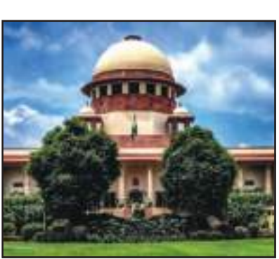
ଚିକିତ୍ସା ପାଇଁ ହସ୍ତିଚାଳରେ ଭର୍ତ୍ତି ହେବା ପରେ ତାଙ୍କୁ ସୁସ୍ଥ କରି ଘରକୁ ଆଣିବା ତାଙ୍କ ପରିବାର ସଦସ୍ୟଙ୍କ ଏକମାତ୍ର ଲକ୍ଷ୍ୟ ରହିଥାଏ। କିନ୍ତୁ ସବୁ ଘରୋଇ ହସ୍ତିଚାଳରେ ରୋଗୀଙ୍କ ନିକଟତମ କ'ଣ ଘଟୁଛି ସରକାର କିଭଳି ଜାଣିପାରିବେନି ବୋଲି ସୁପ୍ରିମକୋର୍ଟ ପ୍ରଶ୍ନ କରିଛନ୍ତି। ଏଥିପାଇଁ କ'ଣ ନ୍ୟାୟିକ ନିର୍ଦ୍ଦେଶ ଦେବାର ଅବକାଶ ଅଛି କି ବୋଲି ଖଣ୍ଡପାଠ କହିଛନ୍ତି। ଜଣେ ରୋଗୀ

କିମ୍ବା ସରକାରୀ ଚକ୍ର ବର ରୋଗୀମାନଙ୍କ ପାଇଁ କାଳ ହୋଇଛି। ବିଶେଷ କରି ଗରିବ ରୋଗୀମାନଙ୍କ ପାଇଁ ଏହା ଅପହସ୍ତ ହୋଇପଡ଼ୁଛି। ରୋଗୀଙ୍କ ଉପକ୍ରମ ବଢ଼ାଇବାରେ ଅପେକ୍ଷାକୃତ କମ୍ ମୂଲ୍ୟରେ ଉପକ୍ରମ ହେଉଥିଲେ ହେଁ ରୋଗୀମାନଙ୍କୁ ଘରୋଇ ହସ୍ତିଚାଳ ପରିସରରେ ରହିଥିବା ଉପକ୍ରମକୁ ଉପକ୍ରମ କରିବାକୁ ବାଧ୍ୟ କରାଯାଉଛି। ଏହାଦ୍ୱାରା ରୋଗୀମାନେ ଖର୍ଚ୍ଚା ହେଉଥିଲା ବେଳେ ଘରୋଇ ହସ୍ତିଚାଳ କର୍ତ୍ତୃପକ୍ଷ ମନଇଚ୍ଛା ଲୁଚୁଛନ୍ତି। ଏସମ୍ପର୍କରେ ରାଜ୍ୟ ସରକାରମାନେ ସବୁକିଛି କାଣି ସୁଜା ଅଜଣା ଭଳି ରହୁଛନ୍ତି। ଦେଶରେ ଏତେ ସଂଖ୍ୟାରେ ଘରୋଇ ହସ୍ତିଚାଳ କାର୍ଯ୍ୟ କରୁଥିବା ବେଳେ ସେଠାରେ କ'ଣ ଘଟୁଛି ସରକାର କିଭଳି ଜାଣିପାରିବେନି ବୋଲି ସୁପ୍ରିମକୋର୍ଟ ପ୍ରଶ୍ନ କରିଛନ୍ତି। ଏଥିପାଇଁ କ'ଣ ନ୍ୟାୟିକ ନିର୍ଦ୍ଦେଶ ଦେବାର ଅବକାଶ ଅଛି କି ବୋଲି ଖଣ୍ଡପାଠ କହିଛନ୍ତି। ଜଣେ ରୋଗୀ