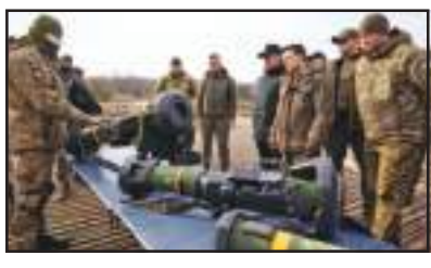
ଜେଲେନସ୍କିଙ୍କ ମଧ୍ୟରେ ହୋଇଥିବା ଯୁକ୍ତେନ ପରେ ଏପରି ପରିସ୍ଥିତି ସୃଷ୍ଟି ହୋଇଥିଲା। ଟ୍ରମ୍ପଙ୍କ ସାମଗ୍ରିକ ସହାୟତା ବନ୍ଦ ନିଷ୍ପତ୍ତି ପରେ ଜେଲେନସ୍କି ନରମିଛନ୍ତି। ମଙ୍ଗଳବାର ଜେଲେନସ୍କି କହିଛନ୍ତି ଯେ ୟୁକ୍ତେନର ସୁରକ୍ଷା ପାଇଁ ଆମେରିକା ଗ୍ୟାରେଣ୍ଟି ପ୍ରସ୍ତୁତ। ରୁଷ୍ ସହିତ ୟୁକ୍ତେନ ୟୁକ୍ତେନ ଶାନ୍ତି ପ୍ରତିଷ୍ଠା ପାଇଁ ଟ୍ରମ୍ପଙ୍କ ମାର୍ଗଦର୍ଶନରେ ସେ କାମ କରିବେ। ରୁଷ୍ ସହିତ ଚାଲିଥିବା ୟୁକ୍ତେନ ବନ୍ଦ କରିବାକୁ ସେ ସମସ୍ତ ପ୍ରକାର ଆଲୋଚନାରେ ଅଂଶ ଗ୍ରହଣ କରିବାକୁ ପ୍ରସ୍ତୁତ। ୟୁକ୍ତେନସାଧାରଣ ସହିତ ସେ ୟୁକ୍ତେନ ବନ୍ଦ କରିବାକୁ ବିଶେଷ ଆଗ୍ରହୀ ବୋଲି ଜେଲେନସ୍କି କହିଛନ୍ତି। ରୁଷ୍ ବିରୋଧରେ ୟୁକ୍ତେନ ବନ୍ଦ କରିବା ଲାଗି

ଝାଞ୍ଚନ : ୟୁକ୍ତେନକୁ ଆମେରିକା ଦେଉଥିବା ସାମଗ୍ରିକ ସହାୟତାକୁ ରାଷ୍ଟ୍ରପତି ଡୋନାଲ୍ଡ୍ ଟ୍ରମ୍ପ ବନ୍ଦ କରିଦେଇଛନ୍ତି। ରୁଷ୍ ସହିତ ୟୁକ୍ତେନ ବନ୍ଦ ଲାଗି ପ୍ରସ୍ତାବିତ ଶାନ୍ତି ବୃତ୍ତାନ୍ତର ଗ୍ରହଣ କରିବାକୁ ୟୁକ୍ତେନ ଉପରେ ଚାପ ପକାଇବା ଉଦ୍ଦେଶ୍ୟରେ ଟ୍ରମ୍ପ ଏପରି ପଦକ୍ଷେପ ନେଇଛନ୍ତି। ରୁଷ୍ ବିରୋଧୀ ୟୁକ୍ତେନ ବନ୍ଦ ଲାଗି ପ୍ରସ୍ତାବିତ ଶାନ୍ତି ବୃତ୍ତାନ୍ତରେ ସୁଧାର କରିବା ଲାଗି ୟୁକ୍ତେନ ରାଷ୍ଟ୍ରପତି ଭୋଲଡେନିର ଜେଲେନସ୍କି ଆମେରିକା ଠାରୁ ସୁରକ୍ଷା ଗ୍ୟାରେଣ୍ଟି ଲୋଡ଼ିଥିବାବେଳେ ଟ୍ରମ୍ପ ଏପରି ନିଷ୍ପତ୍ତି ନେଇଛନ୍ତି। ୟୁକ୍ତେନର ସୁରକ୍ଷା ପାଇଁ ଆମେରିକା ଗ୍ୟାରେଣ୍ଟି ଦେଲେ ସେ ଶାନ୍ତି ବୃତ୍ତାନ୍ତରେ ସୁଧାର କରିବେ ବୋଲି ଜେଲେନସ୍କି ସର୍ତ୍ତ ରଖିଥିଲେ। ମାତ୍ର ଟ୍ରମ୍ପ କହିଥିଲେ ଯେ ୟୁକ୍ତେନ ସାଧାରଣ ଲୋକଙ୍କ ଜୀବନ ହାନି ଘଟୁଛି। ତେଣୁ ଏହି ଜୀବନ ହାନି ରୋକିବା ଲାଗି ଶାନ୍ତି ପ୍ରସ୍ତାବକୁ ୟୁକ୍ତେନ ଗ୍ରହଣ କରିବା ଦରକାର। ଗତ ସପ୍ତାହରେ ୟୁକ୍ତେନ ସାହାଯ୍ୟରେ ଶାନ୍ତି ଆଲୋଚନା ବେଳେ ଟ୍ରମ୍ପ ଓ