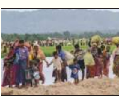
ଯୋଜନାକୁ କାର୍ଯ୍ୟକାରୀ କରିବା ପାଇଁ ଆଇଏସଆଇ ଏକ ରଣନୀତି ପ୍ରସ୍ତୁତ କରୁଛି। ଏହାର ଲକ୍ଷ୍ୟ ହେଉଛି ରୋହିଙ୍ଗାମାନଙ୍କୁ ଅସୁବିଧାରେ ପକାଇବା, ସେମାନଙ୍କୁ ଭାରତ ପଠାଇବା ଏବଂ ଆଡ଼କବାଦୀ ଘଟଣା ଘଟାଇବା। ରିପୋର୍ଟରେ କୁହାଯାଇଛି, ତିପୁରା ଏବଂ ମିଜୋରାମ ସୀମାବର୍ତ୍ତୀ

ଦାରିଦ୍ର୍ୟତାର ସୁଯୋଗ ନେବା। ରୋହିଙ୍ଗା ଶରଣାର୍ଥୀମାନେ ୨୦୦-୪୦୦ ଟଙ୍କା ପାଇଁ ମଧ୍ୟ ବଡ଼ ଅପରାଧ କରିବାକୁ ପ୍ରସ୍ତୁତ। ଶେଖ୍ ହସିନା ମଧ୍ୟ ରୋହିଙ୍ଗାମାନଙ୍କ ଉପରେ ବହୁତ ବିରକ୍ତ ଥିଲେ ଏବଂ ସେ ଖୋଲାଖୋଲି କହିଥିଲେ ଯେ, ରୋହିଙ୍ଗାମାନେ ବାଲାଦେଶରେ ଲୁଚିପାତ କରୁଛନ୍ତି। ଗଣମାଧ୍ୟମର ଏକ ରିପୋର୍ଟରେ ଦାବି କରାଯାଇଛି, ପାକିସ୍ତାନ, ମୌଳିକତା ବାଲାଦେଶ ଗୋଷ୍ଠୀମାନଙ୍କ ସହ ମିଶି, ରୋହିଙ୍ଗା ଶରଣାର୍ଥୀଙ୍କ ସକଟର ସୁଯୋଗ ନେଇ ସେମାନଙ୍କୁ ତାଲିମ ପ୍ରଦାନ କରି ଭାରତର ପୂର୍ବ ସୀମାରେ ସେମାନଙ୍କୁ ଅନୁପ୍ରବେଶ କରିବାକୁ ଚେଷ୍ଟା କରୁଛି। ପାକିସ୍ତାନ ବାଲାଦେଶ ଦେଇ ଭାରତକୁ ଆଡ଼କବାଦୀ ପଠାଇବାକୁ ଚାହୁଁଛି। ରିପୋର୍ଟ ଅନୁଯାୟୀ, ଏହି