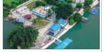
ପିନକ ସହ, ଥିମ୍ ପାର୍କ, ଓପନ ଏଆର୍ ଆଣ୍ଡ ଥିଏଟର, ସେନ୍ଟ୍ରାଲ ପାର୍କ, ସନଟୁବ୍ ଡେକ୍, ବଟର ଫ୍ଲୁଏ ଗାର୍ଡେନ, ସେନ୍ଟ୍ରାଲ ପାର୍କ ନିର୍ମାଣ କରାଯିବ। ନେଇ ଯୋଜନା ହୋଇଛି। ଏହା ସଂପୂର୍ଣ୍ଣ ଭାବେ ଇକୋ ଫ୍ରେଣ୍ଡଲି ହେବ। ଆସନ୍ତା ବାଲିଯାତ୍ରା ସୁଦ୍ଧା ପ୍ରଥମ ପର୍ଯ୍ୟାୟ କାମ ସାରିବାକୁ ଲକ୍ଷ୍ୟ ରଖାଯାଇଛି। ସିଡିଏ ଏହି କାମକୁ ଦ୍ୱାରଦ୍ୱିତ କରିବ। ୨୮୨ ଏକର ସ୍ଥାନକୁ ବ୍ୟବସ୍ଥା, ଫୁଡ୍ କୋର୍ଟ, ଷ୍ଟଲ, ଷୋର୍ଟସ, ଭବନ

ଭୁବନେଶ୍ୱର : ଖୁବଶୀଘ୍ର ଆରମ୍ଭ ହେବ କଟକ ମହାନଦୀ ରିଭର ଫ୍ରଣ୍ଟ ପ୍ରକଳ୍ପ। ୨୨୦କୋଟି ଟଙ୍କା ବ୍ୟୟ ଅଟକଳରେ ମହାନଦୀ ରିଭର ଫ୍ରଣ୍ଟ ପ୍ରକଳ୍ପ ଆରମ୍ଭହେବା ନେଇ ଗୃହ ଓ ନଗରଭିକାଶ ମନ୍ତ୍ରାଳୟ ତରଫରୁ ମହାପାତ୍ର ସୂଚନା ଦେଇଛନ୍ତି। ଭୁବନେଶ୍ୱରର ଖାରବେଳ ଭବନରେ ଗୁରୁବାର ଗୃହ ନିର୍ମାଣ ଓ ନଗର ଭିକାଶ ମନ୍ତ୍ରାଳୟ ଅଧିକାରୀ ଏନେଇ ଏକ ବୈଠକ ଅନୁଷ୍ଠିତ ହୋଇଯାଇଛି। ରିଭରଫ୍ରଣ୍ଟ ପ୍ରକଳ୍ପ ଡିପାର୍ଟମେଣ୍ଟର ରାଜ୍ୟ ସରକାରଙ୍କ ଅନୁମୋଦନପଦକ୍ଷେପ ସାରିଛନ୍ତି। ପ୍ରକଳ୍ପ ପାଇଁ ୨୨୦ କୋଟି ଟଙ୍କା ବ୍ୟୟ ଅଟକଳ ହୋଇଥିବା ବେଳେ ଆବଶ୍ୟକ ପଡ଼ିଲେ ଅଧିକ ବ୍ୟୟ କରାଯିବ। ଏଠାରେ ସ୍ୱତନ୍ତ୍ର ପାର୍ଟି ବ୍ୟବସ୍ଥା, ଫୁଡ୍ କୋର୍ଟ, ଷ୍ଟଲ, ଷୋର୍ଟସ, ଭବନ