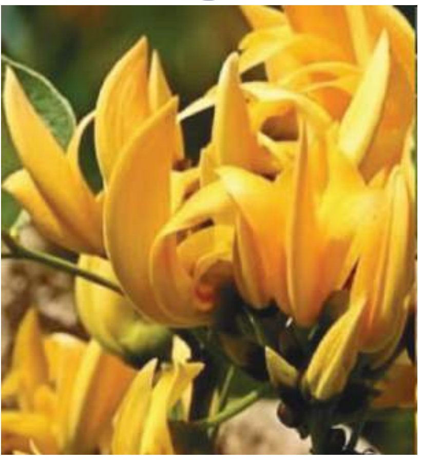
କୁହାଯାଉଥିଲା । ପଲ୍ଲୀଶ ପୁଲର ନାମ ଅନୁଯାୟୀ ପଶ୍ଚିମବଙ୍ଗର ନଦିଆ ଜିଲ୍ଲାର ଗୋଟିଏସହରର ନାମ ପଲ୍ଲୀଶା

ହିନ୍ଦୁ ଧର୍ମରେ ପଲ୍ଲୀଶକୁ ଅଗ୍ନିଦେବଙ୍କ ସ୍ୱରୂପ ଭାବରେ ମାନ୍ୟତା ଦିଆଯାଏ । ତେଣୁ ଏହାର ଅନ୍ୟ ନାମ ଅଗ୍ନିଶିଖା । ଶିବ ଓ ପାର୍ବତୀଙ୍କ ଅନ୍ତରଙ୍ଗ ମୁହୂର୍ତ୍ତକୁ ଗୋପନରେ ଦେଖି ଥିବାରୁ ମା ପାର୍ବତୀଙ୍କ ଅଭିଶାପରେ ରଙ୍ଗର ପ୍ରାଚୁର୍ଯ୍ୟ ଥିବା ପଲ୍ଲୀଶ ପୁଲର ବାସ୍ନା ହରଣ ହୋଇଯାଇଛି । ବାସହୀନ ଓ ଗନ୍ଧହୀନ ବୋଲି କୈାଶସି ଦେବଦେବୀଙ୍କ ପୂଜାରେ ଲାଗୁନଥିବା ପଲ୍ଲୀଶ କେବଳ ଦୋଳ ଯାତ୍ରା ସମୟରେ ବିମାନରେ ଅଧିଷ୍ଠିତ ରାଧାକୃଷ୍ଣଙ୍କ ଚରଣରେ ସମର୍ପିତ ହୋଇଥାଏ । ପଲ୍ଲୀଶ ଗଛରେ ବ୍ରହ୍ମା ବାସ କରନ୍ତି । କର୍କଟ ରାଶିର ବ୍ୟକ୍ତି ଚାରୋଟି ପଲ୍ଲୀଶ ଗଛ ରବି ଓ ସୋମବାର ଲଗାଇଲେ ଯଜ୍ଞର ଫଳ ଲାଭ କରିଥାନ୍ତି ବୋଲି ପୁରାଣମାନଙ୍କରେ ବର୍ଣ୍ଣନା ରହିଛି । ମହାଭାରତର ବର୍ଷନା ଅନୁଯାୟୀ ରକ୍ଷି ଜମଦଗ୍ନୀ ଏକଦା ପଲ୍ଲୀଶ ବନରେ ଦେବତାଙ୍କର ସବୁଝି ପାଇଁ ବିଶାଳ ଯଜ୍ଞର ଆୟୋଜନ କରିଥିଲେ,ଯେଉଁଠାରେ ପୃଥିବୀର ସମସ୍ତ ନଦୀ ଉପସ୍ଥିତ ରହିଥିଲେ । ଦେବାଦେବୀଙ୍କ ଯଜ୍ଞରେ ପଲ୍ଲୀଶ ସମିଧ କାଠ ବ୍ୟବହାର କରାଯାଏ । ହିନ୍ଦୁ ପରିବାରର ପ୍ରତ୍ୟେକ ଅଗଣାରେ ତୁଳସୀ ଚଉରା ପରି କେରଳରେ ପ୍ରତ୍ୟେକ ବ୍ରାହ୍ମଣଙ୍କ ବାଡ଼ିବଗିଚାରେ ପଲ୍ଲୀଶ ଗଛ ଦେଖିବାକୁ ମିଳେ ।