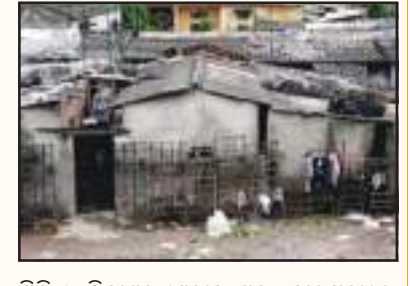
ସ୍ଥିତି ଓ ବିକାଶର ଧାରାକୁ ସ୍ୱତନ୍ତ୍ର କାଠିଗଠାରେ ଠିଆ କରିଛି। ବିଶ୍ୱ ବ୍ୟାଙ୍କ ପକ୍ଷରୁ ପ୍ରତିବର୍ଷ ଭଳି ଚଳିତବର୍ଷ ଦୁର୍ଦ୍ଦିଆର ସବୁଠୁ ଧନୀ ଓ ସବୁଠୁ ସେଲସିୟସ୍ ବଢ଼ିପାରେ। ଏହି ଆକଳନ ଯଦି ଗରିବ ଦେଶଙ୍କ ତାଲିକା ଜାରି କରାଯାଇଥାଏ। ଚଳିତ ବର୍ଷ ଅର୍ଥାତ୍ ୨୦୨୪-୨୫ ବର୍ଷର ଏହି ତାଲିକାରେ ପାକିସ୍ତାନ ୫୦ତମ ସ୍ଥାନରେ ଥିବାବେଳେ ଭାରତର ସ୍ଥାନ ରହିଛି ୬୨। ମୋଟ ସ୍ଥାନ ୬୨ତମ ସ୍ଥାନରେ ରହିବା ଦେଶର ଆର୍ଥିକ

ନୂଆଦିଲ୍ଲୀ : ଭାରତ ସରକାର ପାଞ୍ଚ ତ୍ରିଲିୟନ ଅର୍ଥନୀତିର ସ୍ୱପ୍ନ ଦେଖୁଛନ୍ତି। ବର୍ତ୍ତମାନ ବିକାଶଶୀଳ ରାଷ୍ଟ୍ର ଶ୍ରେଣୀରେ ଥିବା ଭାରତ ୨୦୪୭ ସୁଦ୍ଧା ଏକ ବିକଶିତ ରାଷ୍ଟ୍ର ସହ ତୃତୀୟ ବୃହତ୍ତମ ଅର୍ଥନୀତିରେ ପରିଣତ ହେବ ବୋଲି କେନ୍ଦ୍ର ସରକାର ଦେଶବାସୀଙ୍କୁ ସ୍ୱପ୍ନ ଦେଖାଇଛନ୍ତି। ଦେଶରେ ଯେତେବେଳେ କୋଟି କୋଟି ଲୋକ ଦିନକୁ ଦୁଇ ଓଲି ଭଲ ଭାବେ ଖାଇବାକୁ ପାଉନାହାନ୍ତି ଓ ଖାଦ୍ୟ ନିରାପଣା ଯୋଜନାରେ ସେମାନଙ୍କୁ ମାଗଣା ଖାଦ୍ୟପ୍ରଦାନ ଯୋଗାଇ ଦିଆଯାଉଛି, ସେତେବେଳେ ବିକଶିତ ଭାରତ ଗଠନ ସ୍ୱପ୍ନ କିପରି ପୂରଣ ହେବ ବୋଲି ପ୍ରଶ୍ନ ଉଠିଛି। ଏହି କ୍ରମରେ ବିଶ୍ୱବ୍ୟାଙ୍କ ଦ୍ୱାରା ପ୍ରକାଶିତ ରିପୋର୍ଟରେ ଗରିବ ଦେଶ ସୂଚୀରେ ଭାରତର ସ୍ଥାନ ୬୨ତମ ସ୍ଥାନରେ ରହିବା ଦେଶର ଆର୍ଥିକ