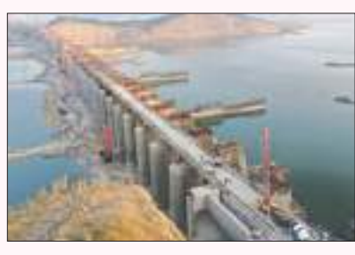
ବିରୋଧରେ ମୋଟୁରେ ବିଜେଡିର ଆନ୍ଦୋଳନ। ସାମାଜିକ ହୋଇଥିଲେ ଦଳର ଆଗ ଧାଡ଼ିର ନେତା। ଯେଉଁ ପୋଲାଭରମ ବିରୋଧରେ ବିଜେଡି ଏବେ ବିରୋଧ ଏବେ କରୁଛନ୍ତି ଆନ୍ଦୋଳନ। ସେପଟେ ପୋଲାଭରମ ପ୍ରସଙ୍ଗରେ ବିଜେଡି ସହ ଆନ୍ଦୋଳନରେ ସାମିଲ ହେବାକୁ ମନା କଲା ମାଲକାନାଗିରି କଂଗ୍ରେସ। ପୋଲାଭରମ

ଭୁବନେଶ୍ୱର : ନଦୀକୁ କେନ୍ଦ୍ର ବିରୋଧୀ ଅସ୍ତ୍ର କରିଛି ବିଜେଡି। କିନ୍ତୁ ମହାନଦୀ କଳା ବ୍ୟାଙ୍କ ଫାଉଣ୍ଡର ଏବେ ପୋଲାଭରମର ଖୋଲୁଛି ପୋଲ। ବିଜୁ ବାବୁ କେନ୍ଦ୍ରମନ୍ତ୍ରୀ ଥିବା ବେଳେ ଆନ୍ଧ୍ର ସହ ଲୁଚାଛପାରେ ହୋଇଥିଲା ତୁଳି। ନା ଏ ଏସପିକିରେ ବିଧାନସଭାରେ ଆଲୋଚନା ହୋଇଥିଲା ନା ଓଡ଼ିଶାବାସୀ କିଛି ଜାଣିପାରିଥିଲେ। ବିଜେଡି ଶାସନରେ ପୋଲାଭରମକୁ ଦେଇଥିଲେ ଏନ୍‌ଓସି। ସେତେବେଳେ କେବଳ ବିଦୁତିରେ କରିଥିଲେ ବିରୋଧ ଏବେ କରୁଛନ୍ତି ଆନ୍ଦୋଳନ। ସେପଟେ ପୋଲାଭରମ ପ୍ରସଙ୍ଗରେ ବିଜେଡି ସହ ଆନ୍ଦୋଳନରେ ସାମିଲ ହେବାକୁ ମନା କଲା ମାଲକାନାଗିରି କଂଗ୍ରେସ। ପୋଲାଭରମ