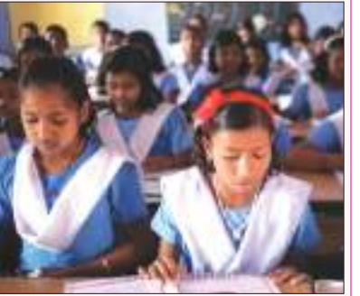
ପ୍ରତିଶତ ପିଲା ଫେଡ଼ାଣ ଜାଣି ନଥିଲେ । ୨୦୨୪ ରେ ଏହି ହାର ୬୯.୫ ପ୍ରତିଶତରେ ପହଞ୍ଚିଛି । ସେହିପରି ୨୦୧୪ରେ ୩୭.୯ ପ୍ରତିଶତ ପିଲା ହରଣ ଜାଣି ନଥିଲେ । > ପୃ-୬