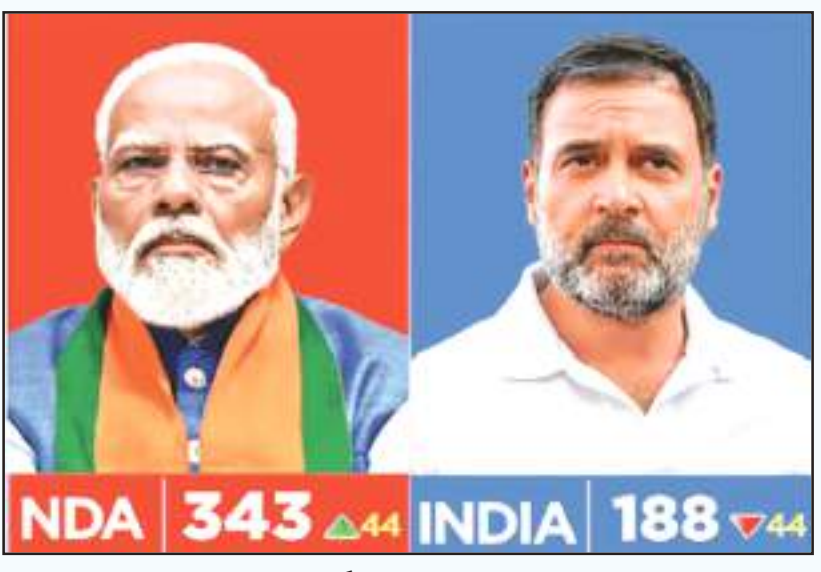
ସାଙ୍ଗରେ ନରେନ୍ଦ୍ର କଂଗ୍ରେସ ଏକା ନିର୍ବାଚନ ଏକଥା ମରାଠା ନେତା ଶରଦ ପାଠାନ୍ କହି ଲଢ଼ିବାରୁ ମେଣ୍ଟ ଆଉ ନାହିଁ କହିଲେ ତଳେ ।

ଫେବୃଆରୀ ୯ ତାରିଖ ମଧ୍ୟରେ ଏହି ସର୍ବେକ୍ଷଣ କରାଯାଇଥିଲା । ଦେଶର ୧,୨୫,୧୨୩ ଲୋକଙ୍କଠାରୁ ମତ ସଂଗ୍ରହ କରାଯାଇ ଏହି ରିପୋର୍ଟ ପ୍ରସ୍ତୁତ କରାଯାଇଛି । ରିପୋର୍ଟ ଅନୁସାରେ ଦେଶର ଲୋକମାନେ ପୁଣି ଥରେ କଂଗ୍ରେସ ଆଡ଼କୁ ମୁହଁ ଫେରାଇଲେଣି । ୨୦୨୪ ସାଧାରଣ ନିର୍ବାଚନ ପୂର୍ବରୁ କଂଗ୍ରେସ ଓ ଅନ୍ୟ କେତେକ ଦଳ ଏକତ୍ର ହୋଇ ବିଜେପି ଓ ଏହାର ନେତୃତ୍ୱାଧୀନ ଏନଡିଏ ବିରୋଧରେ ଲଢ଼ିବାରୁ ସେମାନଙ୍କର ଆସନ ସଂଖ୍ୟା ବୃଦ୍ଧି ପାଇଥିଲା । ମାତ୍ର, ଏହା ପରଠାରୁ ଏହି ତଥ୍ୟକୁ ମେଣ୍ଟର କୌଣସି ବୈଠକ ବସି ନାହିଁ । ଏହା କିଭଳି ବିକଳ ଲକ୍ଷ୍ୟହୀନ ଦେବ ତାହା ସ୍ଥିର ହୋଇନାହିଁ । ଅଧିକତ୍ର ଲୋକସଭା ନିର୍ବାଚନ ପରେ କଂଗ୍ରେସ ଓ ଏହାର ସହଯୋଗୀ ଦଳଙ୍କ ମଧ୍ୟରେ ମତଭେଦ ବୃଦ୍ଧି ପାଇବାର ଲାଗିଛି । କେତେକ ରାଜ୍ୟ ନିର୍ବାଚନରେ ସହଯୋଗୀ ଦଳଗୁଡ଼ିକୁ