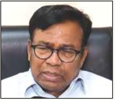
କରିଛନ୍ତି । ଯେଉଁମାନଙ୍କୁ କୌଣସି ନା କୌଣସି ପରିସ୍ଥିତିରେ ଦଳରୁ ନିଲମ୍ବନ ଓ ବହିଷ୍କାର କରାଯାଇଥିଲା, ତାକୁ ପ୍ରତ୍ୟାହାର କରି ଦିଆଗଲା । ବିଭିନ୍ନ ସମୟରେ କୌଣସି ନାକୌଣସି କାରଣରୁ ଯେଉଁମାନେ କଂଗ୍ରେସ ଛାଡ଼ି ଚାଲି ଯାଇଛନ୍ତି