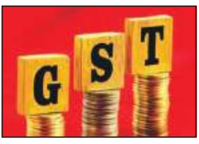
ଜିଏସ୍ଟି ସାମଗ୍ରୀ ୪୦% ପ୍ଲୁରରେ ରହିବ। ଏହି ନିଷ୍ପତ୍ତି ପରେ, ପୂର୍ବରୁ ୧୨% ଚିକିତ୍ସା ଲାଗୁ ହେଉଥିବା ପ୍ରାୟ ୯୯% ସାମଗ୍ରୀ ଏବେ ୫% ପ୍ଲୁରରେ ଆସିବ।

କେବଳ ଦୁଇଟି ପ୍ଲୁର ରଖାଯିବ। ସରଳ ଭାଷାରେ କହିଲେ ୧୨% ଏବଂ ୨୮% ଜିଏସ୍ଟି ପ୍ଲୁର ଉଚ୍ଚେକ କରାଯିବ ଏବଂ କେବଳ ୫% ଏବଂ ୧୮% ପ୍ଲୁର ରହିବ। ବିହାର ଉପମୁଖ୍ୟମନ୍ତ୍ରୀ ସମ୍ରାଟ ଚୌଧୁରୀଙ୍କ ନେତୃତ୍ୱରେ ବସିଥିବା ୬ ସଦସ୍ୟ ବିଶିଷ୍ଟ ମନ୍ତ୍ରୀଙ୍କ ବୈଠକରେ ନିଷ୍ପତ୍ତି ହୋଇଛି ଯେ, ଜିଏସ୍ଟି ହାରକୁ କେବଳ ଦୁଇଟି ପ୍ଲୁରରେ ବିଭକ୍ତ କରାଯିବ।