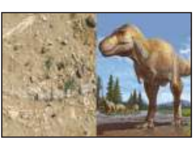
ଗଠନ ମିଳିଛି। ଏଥିରୁ କିଛି ଖଣ୍ଡ ଜୀବାଶ୍ମ କାଠି ପରି ଦେଖାଯାଇ ଥିବା ବେଳେ ଆଉ କିଛି ହାଡ଼ ପରି ଦେଖାଯାଇଛି। ବିଶେଷତା ମତରେ ପଶ୍ଚିମ ରାଜସ୍ଥାନରେ ଜୀବାଶ୍ମ କାଠି ଅସାମାନ୍ୟ ନୁହେଁ, କିନ୍ତୁ ହାଡ଼ ଭଳି ଗଠନର ଉପସ୍ଥିତି ଏହି ଆବିଷ୍କାରକୁ ସ୍ୱତନ୍ତ୍ର କରିଥାଏ।