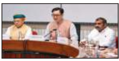
କହିବା ଗଣତାନ୍ତ୍ରିକ ଅଧିକାର। ହେଲେ ସଂସଦରେ ସରକାରଙ୍କ କାମରେ ବାଧା ଦେବା ଓ ଏହାକୁ ରୋକିବା ଅଗଣତାନ୍ତ୍ରିକ। ରିଜିକୁ ରୂପାନ୍ତର ଲୋକସଭାରେ ଗୃହମନ୍ତ୍ରୀ ଅମିତ ଶାହଙ୍କ ଦ୍ୱାରା ଉପସ୍ଥାପନ କରାଯାଇଥିବା ବିଧେୟକକୁ ବିପକ୍ଷ ବିରୋଧୀଙ୍କୁ ଉଲ୍ଲେଖ କରିଛନ୍ତି।

ନୂଆଦିଲ୍ଲୀ : ସଂସଦର ମୌସୁମୀ ଅଧିବେଶନ ଗୁରୁବାର ଅନିଷ୍ଠିତ କାଳ ପାଇଁ ସ୍ଥିତି ହୋଇଯାଇଛି। ଏହା ପରେ ସଂସଦ ପରିସରରେ ସଂସଦୀୟ ବ୍ୟାପାର ମନ୍ତ୍ରୀ କିରେନ ରିଜିକୁ ସାମ୍ବାଦିକ ସମିଳନୀ କରି ମୌସୁମୀ ଅଧିବେଶନ ସଂସଦୀୟ କାର୍ଯ୍ୟ ୧୦୦ ପ୍ରତିଶତ ସଫଳ ହୋଇଥିବା କହିଛନ୍ତି।