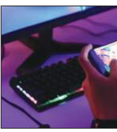
ରେଜିଷ୍ଟର କରିବା ଏବଂ କେଉଁ ଗେମ୍‌ଗୁଡ଼ିକ ଚଳାଇବା ପାଇଁ ଏକ ସ୍ୱତନ୍ତ୍ର ପ୍ରାଧିକାର ଗଠନ ହେବ। ଟଙ୍କା ଅର୍ପଣ କରୁଥିବା ଗେମ୍ ବନ୍ଦ କରିବାର କାରଣ ହେବ।

ଅର୍ଥ ଅନଲାଇନ୍ ଗେମ୍‌ ବିଲ୍ ୨୦୨୫ ପାସ୍ ହୋଇଛି। ବିଲ୍ ଆଇନରେ ପରିଣତ ହେଲେ ଟଙ୍କା ଅର୍ପଣ କରୁଥିବା ଗେମ୍, ଏହାକୁ ଚଳାଇବା ଓ ପ୍ରଚାର କରିବା ବେଆଇନ ହେବ।