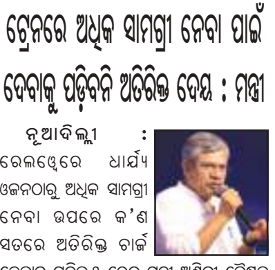
ଟ୍ରେନରେ ଅଧିକ ସାମଗ୍ରୀ ନେବା ପାଇଁ ଦେବାକୁ ପଡ଼ିବନି ଅତିରିକ୍ତ ଦେଶ : ମନ୍ତ୍ରୀ

ନୂଆଦିଲ୍ଲୀ : ରେଳ ଡେ଼ରେ ଧାର୍ଯ୍ୟ ଓଜନଠାରୁ ଅଧିକ ସାମଗ୍ରୀ ନେବା ଉପରେ କ'ଣ ସତରେ ଅତିରିକ୍ତ ଚାର୍ଜ ଦେବାକୁ ପଡ଼ିବ ? ରେଳ ମନ୍ତ୍ରୀ ଅଶ୍ୱିନୀ ଦେବିଙ୍କୁ ଏବେ ଏହା ଉପରେ ସ୍ପଷ୍ଟୀକରଣ ଦେଇଛନ୍ତି। ସେ ଏଭଳି ଖବରକୁ ଖଣ୍ଡନ କରିବା ସହ ଏହା ଭୁଲ ବୋଲି କହିଛନ୍ତି।