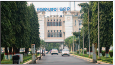
ବାହାର ଅନୁପସ୍ଥିତି ଭାବେ ବିବେଚନା କରାଯିବ । ନୂଆ ନିୟମ ଅନୁଯାୟୀ, ଯେକୌଣସି ଦିନ ପାଇଁ ସର୍ବାଧିକ ୩୦ ମିନିଟ୍ ବିଳମ୍ବ କିମ୍ବା କରାଯାଇପାରିବ, ଯାହା ଗୋଟିଏ ମାସରେ ସର୍ବାଧିକ ତିନି ଦିନ ପାଇଁ ପ୍ରଯୁଜ୍ୟ । ଯଦି କୌଣସି କର୍ମଚାରୀ ଗୋଟିଏଦିନ ଅଧିକ ୩୦ ମିନିଟ୍ ଲେଖାଏଁ କାର୍ଯ୍ୟକ୍ରମକୁ ଆସିବାରେ ବିଳମ୍ବ କରନ୍ତି ଓ

ଭୁବନେଶ୍ୱର : ରାଜ୍ୟରେ ମୋହନ ମାଝୀଙ୍କ ନେତୃତ୍ୱାଧୀନ ସରକାର ନିଜର ଏକବର୍ଷ ପୂର୍ଣ୍ଣ ନେତୃତ୍ୱାଧୀନ ସରକାର ନିଜର ଏକବର୍ଷ ପୂର୍ଣ୍ଣ ପାଳନ କରୁଛି । ଆଉ ଏପଟେ ରାଜ୍ୟ ସରକାର ନିଜର କର୍ମଚାରୀ ଓ ଅର୍ଥସରମାନଙ୍କୁ 'ସମାନ୍ତରାଳିନୀ'ର ପାଠ ପଢ଼ାଇବାକୁ ଯାଇ କଡ଼ା ନିର୍ଦ୍ଦେଶନା ଜାରି କରିଛନ୍ତି । ସରକାରୀ ଅର୍ଥସବୁ ବିଳମ୍ବରେ ଆସିବା ଉପରେ ପୂର୍ଣ୍ଣସ୍ତର ପକାଇବା ନିମନ୍ତେ ସରକାର ଏଆଇ ଆଧାରିତ କ୍ୟାମେରା, ରେଡିଓ ଫ୍ରିକ୍ୱେନ୍ସି ଆଇକାର୍ଡ ଓ ଜଗତୀୟ ଗୀତର ୩୦ ମିନିଟ୍ ବିଳମ୍ବ ପାଇଁ ଗୋଟିଏଦିନର ସିଏଲ୍ କାଟିଦେବା ଭଳି କଠୋର ନିଷ୍ପତ୍ତି ନେଇଛନ୍ତି । ଏହି ନିର୍ଦ୍ଦେଶନା ମାତ୍ର ରାଜ୍ୟ ସରକାରଙ୍କ ପିଅନର୍ ସର୍ବିସ ପର୍ଯ୍ୟନ୍ତ ସବୁବର୍ଗର ଅର୍ଥସର ଓ କର୍ମଚାରୀଙ୍କ ନିମନ୍ତେ କାର୍ଯ୍ୟକାରୀ ହେବ ବୋଲି ଜଣାପଡ଼ିଛି । କାର୍ଯ୍ୟକ୍ରମରେ କର୍ମଚାରୀ ଓ ଅର୍ଥସରମାନଙ୍କ ବିଳମ୍ବରେ ଆସିବା ଉପରେ ପୂର୍ଣ୍ଣସ୍ତର ପକାଇବା ବାୟୋମେଟ୍ରିକ୍ ଉପସ୍ଥାନ ସିଷ୍ଟମ ପ୍ରଦାନ କରିବାକୁ ନିର୍ଦ୍ଦେଶ ଦିଆଯାଇଛି । ଏହି ସିଷ୍ଟମ ଗୁଡ଼ିକ ଏନଆଇସି ଦ୍ୱାରା ବିକଶିତ ବାୟୋମେଟ୍ରିକ୍ ଉପସ୍ଥାନ ସିଷ୍ଟମ ପୋର୍ଟାଲ ସହ ସଂଯୁକ୍ତ ହେବ । ଉତ୍ତୋଳ ବିଭାଗରେ ଜଣେ ନିର୍ଦ୍ଦେଶ ଅଧିକାରୀ ପ୍ରତି ପାଖିକ ଭାବେ ଏହି ତଥ୍ୟ ବିଶ୍ଳେଷଣ କରିବେ । ପ୍ରତ୍ୟେକ କର୍ମଚାରୀଙ୍କୁ ଅର୍ଥସର 'ପ୍ରବେଶ' ଓ 'ପ୍ରସ୍ଥାନ' ସମୟ ରେକର୍ଡ କରିବାକୁ ନିର୍ଦ୍ଦେଶ ଦିଆଯାଇଛି । 'ପ୍ରସ୍ଥାନ' ସମୟ ରେକର୍ଡ ନକଲେ