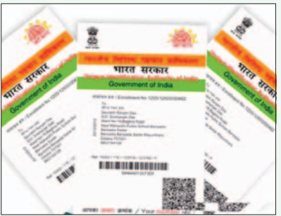
ଯାତ କରିବାରେ ସାହାଯ୍ୟ କରିବ, ସେବା ବିତରଣକୁ ସରଳ କରିବ, ସୁରକ୍ଷା ବୃଦ୍ଧି କରିବ ଏବଂ ଏକାଧିକ ପରିଚୟ ସମ୍ପନ୍ନ ଦାଖଲ କରିବାର ସମସ୍ୟାକୁ ମଧ୍ୟ ହ୍ରାସ କରିବ । ରାଜସ୍ୱ ଓ ବିପର୍ଯ୍ୟୟ ପରିଚାଳନା ବିଭାଗ ଦ୍ୱାରା ଜାରି କରାଯାଇଥିବା ଜାତି, ଆୟ, ଆଇନଗତ ଉତ୍ତରାଧିକାରୀ, ଜମି ରେକର୍ଡ, ରେଜିଷ୍ଟ୍ରେସନ ଆଦି ସମ୍ପର୍କରେ ପ୍ରମାଣପତ୍ର ପ୍ରଦାନରେ ଏହି 'ଆଧାର' ବାଧ୍ୟତାମୂଳକ ହେବ । ୨୦୧୬ ଆଧାର ଆଇନର ଧାରା ୭ ଅନୁଯାୟୀ, ଏହା ମଧ୍ୟ ସରକାରୀ ସେବା ବିତରଣକୁ ସରଳ କରିବ, ପାରଦର୍ଶୀତା ଆଣିବା ସହ ହିତାଧିକାରୀମାନଙ୍କୁ ସିଧାସଳଖ ଲାଭ ପହଞ୍ଚାଇବ । ଏହି ବିଜ୍ଞପ୍ତି ଅନୁଯାୟୀ,

ଭୁବନେଶ୍ୱର : ଏଣିକି ବିଭିନ୍ନ ପ୍ରକାରର ସରକାରୀ ସାର୍ଟିଫିକେଟ୍ ପାଇଁ 'ଆଧାର' ବାଧ୍ୟତାମୂଳକ । ଜାତି, ଆୟ, ଆଇନଗତ ଉତ୍ତରାଧିକାରୀ, ଜମିଜମା ରେକର୍ଡ ଓ ରେଜିଷ୍ଟ୍ରେସନ ନିମନ୍ତେ ଆଧାର ନମ୍ବର ଦେବା ଅବା ଆଧାର ସଂଯୋଗ କରିବା ବାଧ୍ୟତାମୂଳକ ହେବ । କେବଳ ସେତିକି ନୁହେଁ ସରକାରଙ୍କ ବିଭିନ୍ନ ଯୋଜନାରେ ସର୍ବସାଧାରଣ ଉପସ୍ଥାନ ପ୍ରକ୍ରିୟାକୁ ସରଳ, ପାରଦର୍ଶୀ ଓ ବ୍ୟାପକ କରିବା ନିମନ୍ତେ ଏଭଳି ପଦକ୍ଷେପ ନିଆଯାଇଥିବା ଜଣାପଡ଼ିଛି । ରାଜସ୍ୱ ଓ ବିପର୍ଯ୍ୟୟ ପରିଚାଳନା ବିଭାଗ ପକ୍ଷରୁ ଏ ସଂକ୍ରାନ୍ତରେ ବିଧିବଦ୍ଧ ବିଜ୍ଞପ୍ତି ଜାରି ହୋଇଛି । ରାଜ୍ୟ ସରକାର ବିଭିନ୍ନ ପ୍ରକାରର ସାର୍ଟିଫିକେଟ୍‌ର କାଲିଆତି ରୋକିବା ସହ ସରକାରୀ ସେବାରେ ପାରଦର୍ଶୀ ଆଣିବା ନିମନ୍ତେ 'ଆଧାର'କୁ ସେବାରେ ପାରଦର୍ଶୀ ଆଣିବା ନିମନ୍ତେ ଏକ ଦୃଢ଼ ପରିଚୟ ପ୍ରମାଣ ଭାବେ ବ୍ୟବହାର କରିବାକୁ ନିଷ୍ପତ୍ତି ନେଇଛନ୍ତି । ଏହା ହିତାଧିକାରୀଙ୍କ ଯୋଗ୍ୟତା