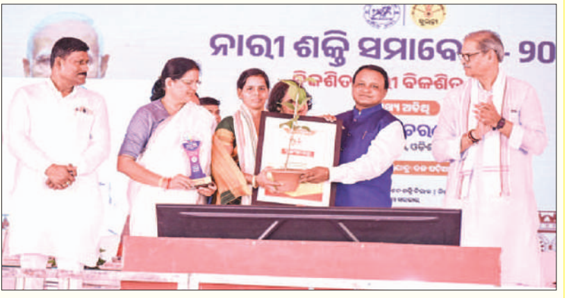
ହୋଇ ନାହିଁ, ରାଜ୍ୟ କେବେ ବି ବିକଶିତ ହୋଇ ପାରିବ ନାହିଁ । ଐତିହାସିକ ସହର କଟକ ଠାରେ ଏହିକାର୍ଯ୍ୟକ୍ରମର ଶୁଭାରମ୍ଭ ଓଡ଼ିଶାର ମାଆ ଓ ଭଉଣୀ ମାନଙ୍କ ପାଇଁ ଏକ ସୁବର୍ଣ୍ଣ ଯୁଗ ଆଣିବ ବୋଲି ମୁଁ ଦୃଢ଼ ନିଶ୍ଚିତ । ନାରୀ ମାନଙ୍କ ସମ୍ପର୍କରେ ପାଇଁ ଆମର ସବୁଠାରୁ ଯତ୍ନାତ୍ମକ ଯୋଜନା ହେଉଛି ଓଡ଼ିଶାର ଇତିହାସରେ ସବୁଠାରୁ ବଡ଼ ମହିଳା କାର୍ଯ୍ୟକ୍ରମ । କେବଳ ମହିଳା ନୁହେଁ ଏତେ ବୃହତ୍ ସାମାଜିକ କଲ୍ୟାଣକାରୀ ଯୋଜନା ପୂର୍ଣ୍ଣ କରାଯାଇ ନ ଥିଲା । ଆମ ସରକାର

ଭୁବନେଶ୍ୱର : ରାଜ୍ୟ ସରକାରଙ୍କ ଏକ ବର୍ଷ ପୂର୍ଣ୍ଣ ପାଳନ ଅବସରରେ ମହିଳା ଓ ଶିଶୁ କଲ୍ୟାଣ ବିଭାଗ ଦ୍ୱାରା କଟକର ବାଲିଯାତ୍ରା ପଡ଼ିଆ ଠାରେ ରାଜ୍ୟସ୍ତରୀୟ ନାରୀ ଶକ୍ତି ସମାବେଶ ଆୟୋଜିତ ହୋଇଯାଇଛି । ଏହି ରାଜ୍ୟସ୍ତରୀୟ ସମାବେଶରେ ମୁଖ୍ୟମନ୍ତ୍ରୀ ମୋହନ ଚରଣ ମାଝୀ ଯୋଗ ଦେଇ କହିଛନ୍ତି ଯେ, ନାରୀଙ୍କୁ ସମ୍ମାନ ପ୍ରଦାନ କରିବା ଆମ ରାଜନୈତିକ ପ୍ରଶିଷ୍ଟର ପ୍ରଥମ ଶିକ୍ଷା । ଏହି ସମାବେଶର ଏକମାତ୍ର ଉଦ୍ଦେଶ୍ୟ ହେଉଛି, ଓଡ଼ିଶାର ନାରୀ ଶକ୍ତିକୁ ଆମର ସବୁଠାରୁ ଶ୍ରେଷ୍ଠ ଶକ୍ତି କରି ରଖିବେ । ନିଜ ଅଭିଭାଷଣରେ ମୁଖ୍ୟମନ୍ତ୍ରୀ କହିଥିଲେ ଯେ, ସରକାର ଏକ ବର୍ଷ ପୂର୍ଣ୍ଣ ପରେ ଦ୍ୱିତୀୟ ବର୍ଷର ପ୍ରଥମ କାର୍ଯ୍ୟକ୍ରମ ହେଉଛି, ଆମର ଏହି ନାରୀ ଶକ୍ତି ସମାବେଶ । କାରଣ, ଆମେ ବିଶ୍ୱାସ କରୁ ଯେ ଯେତେ ପର୍ଯ୍ୟନ୍ତ ରାଜ୍ୟର ଅଧା ଜନସଂଖ୍ୟା ବିକାଶ