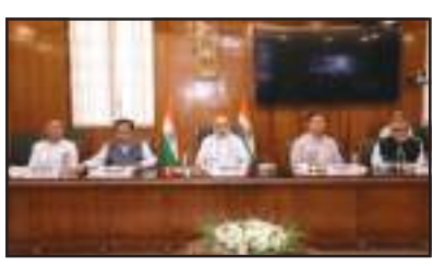
କାଶ୍ମୀର, ପଞ୍ଜାବ, ରାଜସ୍ଥାନ, ଗୁଜରାଟ, ଉତ୍ତରାଖଣ୍ଡ, ଉତ୍ତର ପ୍ରଦେଶ, ବିହାର, ସିକିମ ଏବଂ ପଶ୍ଚିମବଙ୍ଗର ମୁଖ୍ୟମନ୍ତ୍ରୀମାନେ ଏହି ବୈଠକରେ ଯୋଗ ଦେଇଥିଲେ।

ନୂଆଦିଲ୍ଲୀ: ସାମାଜିକ ରାଜ୍ୟ ମୁଖ୍ୟମନ୍ତ୍ରୀଙ୍କ ସହ କେନ୍ଦ୍ର ଗୃହମନ୍ତ୍ରୀ ଅମିତ ଶାହଙ୍କ ଏକ ଜରୁରୀ ବୈଠକ ଅନୁଷ୍ଠିତ ହୋଇଯାଇଛି।