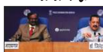
ଉଦ୍ଦେଶ୍ୟ ଏବଂ ସୁଦେଶୀ ପ୍ରଯୁକ୍ତିବିଦ୍ୟା, ଆର୍ଥିକ ସାମର୍ଥ୍ୟ ଏବଂ ଦୂରଦୃଷ୍ଟି ସମ୍ପନ୍ନ ରାଜନୈତିକ ନେତୃତ୍ୱ ଆଧାରରେ ଏକ ବିଶ୍ୱସ୍ତରୀୟ ମହାକାଶ ଶକ୍ତି ଭାବେ ଭାରତର ଉତ୍ତମ ଗୁଣାବଳି ବୋଲି ସେ କହିଥିଲେ। ସେ ଏହା ମଧ୍ୟ ମନେ ପକାଇଥିଲେ ଯେ ପ୍ରଧାନମନ୍ତ୍ରୀ ନରେନ୍ଦ୍ର ମୋଦୀ ମହାକାଶରେ ଭାରତର ଦୀର୍ଘକାଳୀନ ମହାକାଶ ଯତ୍ନ ଶେଷରେ ଉପସ୍ଥାପନ କରିଛନ୍ତି, ଯେଉଁଥିରେ ୨୦୧୫ ସୁଦ୍ଧା ଏକ ଭାରତୀୟ ମହାକାଶ କେନ୍ଦ୍ର ପ୍ରତିଷ୍ଠା ଏବଂ ୨୦୪୦ ସୁଦ୍ଧା ଉତ୍ତର ପ୍ରଥମ ଭାରତୀୟ ଅବତରଣ ସାମିନ ରହିଛି। ମାନବ-ରେଡେଟ ଏଲିଏମ୍ ପ୍ରଥମ ଯାନ, କୁ ଏସ୍ଏସ୍ଏ ସିଷମ ଓ କୁ ମତ୍ୟୁଲ୍ ଏବଂ ସର୍ଭିସ ମତ୍ୟୁଲ୍ ସମସ୍ତ ପରୀକ୍ଷା ଏବଂ ଏକାକରଣରେ ଶେଷ ପର୍ଯ୍ୟାୟ ଦେଇ ଗତି କରୁଛନ୍ତି।