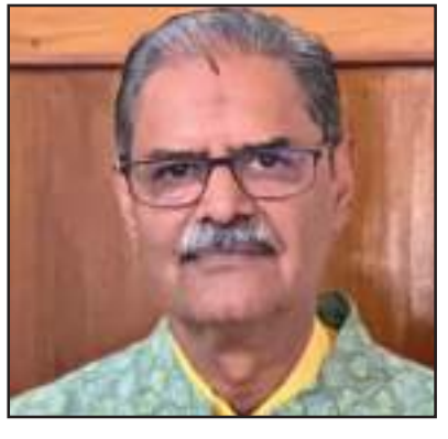
ଅଭିଭାବକ ଆଶିଷ ପାଇଁ ଆମେ ସର୍ବଦା ଚେଷ୍ଟିତ। ଏଥିପାଇଁ ଉପସ୍ଥୁତ ପଦକ୍ଷେପ ଆମେ ଗ୍ରହଣ କରୁଛୁ ବୋଲି ଉପମୁଖ୍ୟମନ୍ତ୍ରୀ ଶ୍ରୀ ସିଂହଦେବ କହିଛନ୍ତି। କୃଷି କ୍ଷେତ୍ରର ବିକାଶରେ ଡିଜିଟାଲ ଟେକ୍ନୋଲୋଜିର ବ୍ୟବହାର କରିବାରେ ଓଡ଼ିଶା ଏକ ଅଗ୍ରଣୀ ରାଜ୍ୟ।

ଭୂବନେଶ୍ୱର : କୃତ୍ରିମ ବୁଦ୍ଧିମତୀର ପ୍ରୟୋଗରେ କୃଷିଭିତ୍ତିକ ଭୌଗଳିକ ତଥ୍ୟକୁ ଅନୁଧ୍ୟାନ କରି ଚାଷୀଙ୍କୁ ଆଗ୍ରାଣୀ ସୂଚନା ପ୍ରଦାନ କରିବା ପାଇଁ ଏଏମଏନଏସଏସ ନାମକ ସଂସ୍ଥା ଆରମ୍ଭ କରିଛି। ଏହି ସଂସ୍ଥାର ପ୍ରତିନିଧିତ୍ୱ ପକ୍ଷରୁ ଆଜି ଲୋକସେବା ଭବନ ସମ୍ମିଳନୀ କକ୍ଷରେ ଏକ ଉପସ୍ଥାପନା ଉପମୁଖ୍ୟମନ୍ତ୍ରୀ ତଥା କୃଷି ଓ କୃଷକ ସମ୍ବଳିକରଣ ମନ୍ତ୍ରୀ କନକ ବର୍ଦ୍ଧନ ସିଂହଦେବଙ୍କୁ ପ୍ରଦର୍ଶନ କରାଯାଇଥିଲା। କୃଷି କ୍ଷେତ୍ରକୁ ଆହୁରି ସୁଦୃଢ଼ କରିବା ପାଇଁ ଦୈନିକ ଜ୍ଞାନ କୌଶଳର ବ୍ୟବହାର ନିରୀକ୍ଷା କରୁଛି। କୃତ୍ରିମ ବୁଦ୍ଧିମତୀର ଉପଯୋଗରେ ପଠିକ୍ ତଥ୍ୟ ହାତପାହାନ୍ତରେ ପାଇବା ସହଜବ୍ୟାଧି ହୋଇପାରିଛି। ଆମ ଦେଶର ମେରୁଦଣ୍ଡ, କୃଷକଙ୍କୁ ସମଯୋଗ୍ୟତା କୃଷି ସମ୍ବନ୍ଧୀୟ ସୂଚନା ପ୍ରଦାନ କରିବାକୁ ଅଭିଭାବକଙ୍କୁ ମନୁଷ୍ୟମାନଙ୍କୁ ନିୟମିତ ଭାବେ ହେଉଛି।