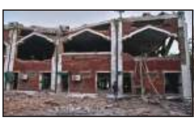
ପ୍ରକାର ପୂର୍ବରୁ ଫ୍ୟାକ୍ଟ ଚେକ୍ କରିବା ପାଇଁ କହିଛି ଚୀନରେ ଥିବା ଭାରତୀୟ ଦୂତାବାସ। ଚୀନରେ ଥିବା 'ଅପରେସନ ସିନ୍ଦୂର' ବାବଦରେ ଦୁର୍ଦ୍ଦିଗ୍ଧାଗ୍ରଣ ବିମାନର ପୁରୁଣା ଫଟୋ ବ୍ୟବହାର କରି ରିପୋର୍ଟ ପ୍ରକାଶ କରିଥିଲା।

ନୂଆଦିଲ୍ଲୀ: ପାକିସ୍ତାନର ମିଛ ପ୍ରୋପାଗଣ୍ଡାର ମୁଖପାତ୍ର ସାଜିଛି ଚୀନର ସରକାରୀ ମିଡ଼ିଆ ଗ୍ଲୋବାଲ୍ ଟାଇମ୍ସ। ପାକିସ୍ତାନ ଏବଂ ପିଓକେର ଆତଙ୍କବାଦୀ ଆତ୍ମା ଉପରେ ଭାରତର କୁଳ ସେପକ୍ଷୀୟ ଆକ୍ରମଣ ବିଷୟରେ ମିଛ ପ୍ରଚାର କରୁଥିବା ଗ୍ଲୋବାଲ୍ ଟାଇମ୍ସରୁ ଚୀନ ଗଣମାଧ୍ୟମ କର୍ମୀଙ୍କୁ ଭାରତୀୟ ସରକାରୀ ଗଣମାଧ୍ୟମର ଅପତ୍ୟକ୍ଷ ଭାବେ କଡ଼ା ସମାଲୋଚନା କରିଛି।