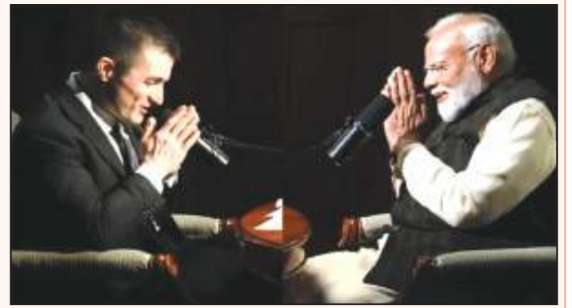
ଭାରତ ପାଇଁ ଚିନ୍ତା ବିଷୟ ନୁହେଁ ସାରା ବିଶ୍ୱ ପାଇଁ ଅଛି । ଭାରତ ପାକିସ୍ତାନକୁ ବାରମ୍ବାର କହି ଆସିଛି ଆତଙ୍କବାଦୀ ପ୍ରଶ୍ନକୁ ଛାଡ଼ିଲେ ଦେଶର ମଙ୍ଗଳ ହେବ । ଭାରତ ଓ ପାକିସ୍ତାନ ମଧ୍ୟରେ ଶାନ୍ତି ପ୍ରତିଷ୍ଠା ପାଇଁ ବାରମ୍ବାର ଉଦ୍ୟମ କରାଯାଇଛି । ଏଥିପାଇଁ ମୁଁ ଲାଜରେ ମାରିପାରୁଛି ।

ନୂଆଦିଲ୍ଲୀ : ପ୍ରଧାନମନ୍ତ୍ରୀ ନରେନ୍ଦ୍ର ମୋଦି ଆମେରିକୀୟ ଘୋଡ଼କାଷ ହୋଷ ଲେଖ ଫୁଟିମେନଙ୍କ ସହ ଏକ ଘୋଡ଼କାଷରେ ଯୋଗଦେଇ ବିଭିନ୍ନ ଦିଗକୁ ନେଇ ଆଲୋଚନା କରିବା ସହ ନିଜର ରାଜନୈତିକ ଅନୁଭୂତି ବର୍ଣ୍ଣନା କରିଛନ୍ତି । ଏହି ପରିପ୍ରେକ୍ଷାରେ ପ୍ରଧାନମନ୍ତ୍ରୀ ୨୦୦୨ ମସିହାରେ ଘଟିଥିବା ଗୋଧ୍ରା ଘଟଣାକୁ ମନେ ପକାଇ ମତାମତ ରଖିଛନ୍ତି । କହିଛନ୍ତି ମୁଁ ୨୦୦୨ ଫେବୃଆରୀ ୨୪ ରେ ପ୍ରଥମ ଥର ପାଇଁ ବିଧାୟକ ହୋଇଥିଲି । ବିଧାୟକ ହେବାର ୩ ଦିନ ପରେ ଘଟିଥିଲା ଗୋଧ୍ରା ଘଟଣା । ନିରାହ ଲୋକଙ୍କୁ ହତ୍ୟାକରି ଜାଳି ଦିଆଯାଇଥିଲା । ସେହି ମୁହୂର୍ତ୍ତକୁ ମନେ ପକାଇ ଦୁଃଖ ପ୍ରକାଶ କରିଛନ୍ତି ପ୍ରଧାନମନ୍ତ୍ରୀ । ପାକିସ୍ତାନର ଆତଙ୍କବାଦୀ ମାନସିକତାକୁ ନେଇ କହିଛନ୍ତି ପାକିସ୍ତାନର ଆତଙ୍କବାଦୀ ମାନସିକତା କେବଳ ଭାରତ ନୁହେଁ ସାରା ବିଶ୍ୱ ଜାଣି ସାରିଛି । ପାକିସ୍ତାନ କେବଳ