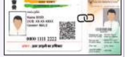
ପଦକ୍ଷେପ ନେବାକୁ ଯାଉଛନ୍ତି ସରକାର । ଲକ୍ଷ୍ମୀ ଆନୁଷ୍ଠାନ ଏକପ୍ରକାର ରିପୋର୍ଟ ଅନୁସାରେ, ୨୦୨୧ ଜନପ୍ରତିନିଧି ଅଧିନିୟମ, ୧୯୫୧ରେ ସଂଶୋଧନ ପରେ ନିର୍ବାଚନ ଆୟୋଗ ମତଦାତାଙ୍କୁ ସ୍ୱେଚ୍ଛାରେ ଆଧାର ନମ୍ବର ସଂଯୋଗ କରିବା ଆରମ୍ଭ କରିଥିଲା । ତେବେ ଏ ପର୍ଯ୍ୟନ୍ତ ନିର୍ବାଚନ ଆୟୋଗ ଆଧାର ଓ ଭୋଟର କାର୍ଡର ତାତ୍ପର୍ଯ୍ୟ ସଂଯୋଗ କରି ନ ଥିଲା । କିନ୍ତୁ ଏବେ ଏହାକୁ ଗୁରୁତର ସହ

ନୂଆଦିଲ୍ଲୀ: ନିର୍ବାଚନୀ ପାରଦର୍ଶିତା ବଜାଜବା ଉଦ୍ଦେଶ୍ୟରେ ଏବେ ଭୋଟର ଆଇଡିକୁ ଆଧାର ସହ ସଂଯୋଗ କରିବା ପ୍ରକ୍ରିୟା କୋରଦାର କରାଯାଇଛି । ପାନକାର୍ଡ ପରି ଏବେ ଭୋଟ ପରିଚୟ ପତ୍ରକୁ ମଧ୍ୟ ଆଧାର ସହ ସଂଯୋଗ କରିବା ଯୋଜନା ଉପରେ ନିର୍ବାଚନ ଆୟୋଗ ଗନ୍ଧାରତାର ସହ କାମ କରୁଛନ୍ତି । ଏହି କ୍ରମରେ ଆଗାମୀ ସପ୍ତାହରେ ନିର୍ବାଚନ ଆୟୋଗକୁ ଗୁରୁତ୍ୱପୂର୍ଣ୍ଣ ବୈଠକ ହେବାକୁ ଯାଉଛି । ଏଥିରେ ଜାରି କରୁଥିବା ସଂଗ୍ରାହ ଯୁଆଇଡିଏଆଇର ଶୀର୍ଷ ଅଧିକାରୀ ଯୋଗ ଦେବେ । ନକଲି କାର୍ଡ ଓ ତୁପୁକେଟ ମତଦାତାଙ୍କୁ ଚିହ୍ନଟ କରି ମତଦାତା ତାଲିକାକୁ ସୂଚ୍ଛ କରିବା ଉଦ୍ଦେଶ୍ୟରେ ଏହି