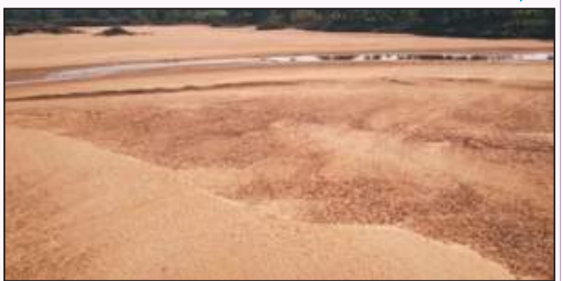
ଉଦ୍‌ବେଗ ପ୍ରକାଶ କଲେଣି ପୂର୍ବତନ ଜଳ ସମ୍ପଦ ମନ୍ତ୍ରୀ ଓ ନାଗରିକ ସୁରକ୍ଷା ମନ୍ତ୍ରୀ । ତେବେ କାହିଁକି ଚଳଚଞ୍ଚଳ ହୋଇପାରୁନି ଜଳସମ୍ପଦ ବିଭାଗ ? ବିସ୍ଥାପିତ ସମସ୍ୟା ଓ ଜଳ ସଂକଟ

ଭୁବନେଶ୍ୱର : ମୁଖ୍ୟମନ୍ତ୍ରୀ ବିଭାଗ । ଖର୍ଚ୍ଚ ହୋଇପାରୁନି ବଜେଟ୍, ଅର୍ଥ । ସରକାର ପରିବର୍ତ୍ତନର ୮ ମାସ ପରେ ବି କାମ ଠପ୍ । କୋମାରେ କି ଜଳ ସମ୍ପଦ ବିଭାଗ ! ଗ୍ରୀଷ୍ମ ଆରମ୍ଭରୁ ଶୁଖିଗଲାଣି ନଦୀ । ଦେଖାଦେଲାଣି ଜଳ ସଂକଟ । ଆଗକୁ ସ୍ଥିତି ଅସମ୍ଭବ ଥିଲା । ମେଘା ଜଳସେଚନ ପ୍ରକଳ୍ପ କଥା ଦୂରରେ ଥିଲା । ଆଗେଇପାରୁନି ଚାଲୁ ରହିଥିବା ଆନ୍ତଃନଦୀ ଜଳାଶୟ ପ୍ରକଳ୍ପ କାମ । କେମିତି ହେବ ଜଳସଂକଟ ମୁକାବିଲା ? ଚିନ୍ତାରେ ଚାଷୀ ଓ ସାଧାରଣ ଲୋକେ । ସ୍ଥିତି ଏମିତି ହେଲାଣି ରାଜଧାନୀ ସମେତ ସବୁ ସହରାଞ୍ଚଳକୁ ଖରାଦିନେ ପାଣି ଯୋଗାଇବା ମୁସ୍କିଲ ହେବାକୁ ଯାଉଛି ।