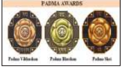
ପଦ୍ମ ବିଭୂଷଣ, ପଦ୍ମ ଭୂଷଣ ଏବଂ ପଦ୍ମଶ୍ରୀ ପୁରସ୍କାର ପ୍ରଦାନ କରାଯାଇଥାଏ। ୧୯୫୪ ମସିହାରେ ପ୍ରତିଷ୍ଠା ହୋଇଥିବା ଏହି ପୁରସ୍କାର ପ୍ରତିବର୍ଷ ଗଣତନ୍ତ୍ର ଦିବସ ଅବସରରେ ଘୋଷଣା କରାଯାଏ। ଏହି ପୁରସ୍କାରସବୁ ସାଧାରଣ ବ୍ୟକ୍ତିବିଶେଷଙ୍କ

ଦୁଆବିଲ୍ଲା : ପଦ୍ମ ପୁରସ୍କାର-୨୦୨୬ ପାଇଁ ନାମାଙ୍କନ ଆଜିଠାରୁ ଆରମ୍ଭ ହୋଇଛି। ପଦ୍ମ ପୁରସ୍କାର ପାଇଁ ନାମାଙ୍କନର ଶେଷ ତାରିଖ ଚଳିତ ବର୍ଷ ଜୁଲାଇ ୩୧ ରହିଛି। ଅନଲାଇନରେ କେବଳ ରାଷ୍ଟ୍ରୀୟ ପୁରସ୍କାର ପୋର୍ଟାଲ https://awards.gov.in ରେ ଏହି ପୁରସ୍କାର ଲାଗି ନାମାଙ୍କନ ଅଥବା ନାମାଙ୍କନ ଲାଗି ସୁପାରିସ ଗ୍ରହଣ କରାଯିବ। ୨୦୨୬ ଗଣତନ୍ତ୍ର ଦିବସ ଅବସରରେ ପୁରସ୍କାର ପାଇଁ ନାମାଙ୍କନର ବ୍ୟକ୍ତିକ ନାମ ଘୋଷଣା କରାଯିବ। ଦେଶର ସର୍ବୋଚ୍ଚ ନାଗରିକ ପୁରସ୍କାର ମଧ୍ୟରୁ ପଦ୍ମ ପୁରସ୍କାର ଅନ୍ୟତମ। ଏହି ବର୍ଷରେ