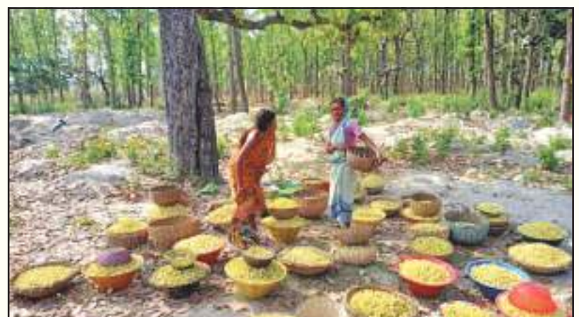
ଏସଏଚଜିଙ୍କୁ ଏହାର କୁଣ୍ଡ ଦାୟିତ୍ୱ ଦେବାକୁ ଥିଲେ ମଧ୍ୟ ଦଲାଲ ଓ ଅବକାରୀ ବିଭାଗର ମସୂଧା ଯୋଗୁଁ ଦାୟିତ୍ୱ ନ ଦେବା ନେଇ ପ୍ରଶ୍ନବାଚୀ ସୃଷ୍ଟି ହୋଇଛି । ଦଲାଲଙ୍କ ଗୋଦାମ ରେ ଅବକାରୀ ବିଭାଗର ପକ୍ଷରୁ ତଡ଼ାଉ କରାଯାଉନାହିଁ । ଓଲଟା ସେମାନଙ୍କ ଠାରୁ ହାତଗୁଞ୍ଜା ନେଇ ଦେଖା ମଦଭାଡ଼ିକୁ ସୁହାଇଲା ଭଳି ଭୂମିକା ଗ୍ରହଣ କରାଯାଇଥିବାରୁ କ୍ଷୋଭ ପ୍ରକାଶ ପାଇଛି । ଗରିବ ଲୋକଙ୍କ ପାଇଁ ମହୁଲ ସଂଗ୍ରହ ଏକ ଜୀବିକା ପାଳିଥିବା ବେଳେ ଦଲାଲ ଯୋଗୁଁ ଉପଯୁକ୍ତ ମୂଲ୍ୟ ନ ପାଇ ସେମାନେ ଅଭାବ ଅନଟନ ଦେଇ ଗତି କରୁଛନ୍ତି । କଳାହାଣ୍ଡି ଜିଲ୍ଲାରେ

କଳାହାଣ୍ଡି: କଳାହାଣ୍ଡି ଜିଲ୍ଲାରେ ଆଦିବାସୀ ମହୁଲଫୁଲ ଏବେ ଦଲାଲଙ୍କ କବଜାରେ । ମହୁଲର ସର୍ବନିମ୍ନ ମୂଲ୍ୟ କେଳି ପିଛା ୨୫ ଟଙ୍କା ଥିବା ବେଳେ ଏହାର ଅଧା ଦାମରେ ବିକ୍ରି କରିବାକୁ ବାଧ୍ୟ ହେଉଛନ୍ତି । ଜିଲ୍ଲାରେ ମହୁଲ ପାଇଁ ବଜାର ବ୍ୟବସ୍ଥା ନ ଥିବା ଯୋଗୁଁ ଆଦିବାସୀ ମାନେ ଅଭାବ ବିକ୍ରିର ସମ୍ମୁଖୀନ ହୋଇ କମ ଦରରେ ମହୁଲକୁ ଦଲାଲ ହାତରେ ଚେକି ଦେଇଛନ୍ତି । ଜିଲ୍ଲା ପ୍ରଶାସନ କିମ୍ବା ସରକାର ଏନେଇ କୌଣସି ପଦକ୍ଷେପ ନ ନେବାରୁ ଏହି ଲଘୁବନଜାତ ଦ୍ରବ୍ୟ ହେବ ଫୁଲକୁ ମହୁଲକୁ ନେଇ ଦଲାଲଙ୍କ ଶିକାର ହେବା ସହିତ ଶାଗମାଛ ଦରରେ ଚେକି