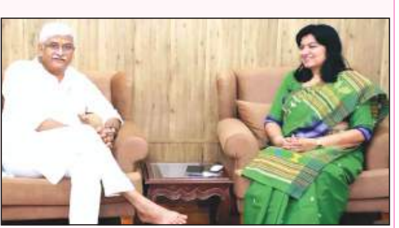
କାଗାମ ସ୍ତରର ମତର୍ଷ ଆର୍ଟ ଗ୍ୟାଲେରୀର ଏକ ଶାଖା ପ୍ରତିଷ୍ଠା ନେଇ କେନ୍ଦ୍ର ସଂସ୍କୃତି ଓ ପର୍ଯ୍ୟଟନ ମନ୍ତ୍ରୀଙ୍କୁ ଶୀଘ୍ର ଏକ ଚିଠି ଲେଖି ଦାବି କରାଯାଇଥିଲା । ଏହି କାଗାମ ସ୍ତରର