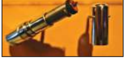
ଅସ୍ତ୍ରଧାରଣ ପରିସ୍ଥିତିରେ ପାଡ଼ିତା ଯଦି ଏହି 'ଲିପ୍ଟିକ୍ ଗନ୍ତ'ର ବନ୍ଦକୁ ଦବାନ୍ତି ତେବେ ସେଥିରୁ ଗୁଳି ଭଳି ଲଙ୍କା ଗୁଣ୍ଡ ବାହାରିବ ଏବଂ ଏହା ଆକ୍ରମଣକାରୀଙ୍କ ଆଖିରେ ଜଳନ ସୃଷ୍ଟି କରିବ ବୋଲି କୁହାଯାଇଛି। ଏଭଳି ସ୍ଥିତିରେ କୌଣସି ସୁଯୋଗ ପାଇବ ନାହିଁ ଏବଂ ଏହି ସୁଯୋଗରେ ମହିଳା ଖସି ପଳାଇବାକୁ ସମର୍ଥ ହେବେ। ସେହିପରି ଗନ୍ତରୁ ଲଙ୍କା ଗୁଣ୍ଡ ଫାଟାରି' ହେବା ବେଳେ ଭୀଷଣ ଶବ୍ଦ ବାହାରିବାର ବ୍ୟବସ୍ଥା

ଦୁଆବିଲ୍ଲା : ମହିଳାଙ୍କ ସୁରକ୍ଷା ଲାଗି ଆଜନ କାନ୍ଦୁନ ପ୍ରଣୟନ କରାଯିବା ସହିତ ବିଭିନ୍ନ ସ୍ତରରେ ନାନା ପଦକ୍ଷେପ ନିଆଯାଉଛି। କିନ୍ତୁ ମହିଳା ବିରୋଧୀ ଅପରାଧ କର୍ମୀଙ୍କ ନାଁ ଧରୁ ନାହିଁ। ବନ୍ଦ ଦିନକୁ ଦିନ ଅତିରୁ ଅତି ଜରମ୍ୟ ଘଟଣା ସାମ୍ରାଜ୍ ଆସିବାରେ ଲାଗିଛି। ତେବେ ମହିଳାଙ୍କ ସୁରକ୍ଷା ପାଇଁ ଉତ୍ତରପ୍ରଦେଶ ଗୋରଖପୁରର ୨ ବିଚେକ୍ ଛାତ୍ରୀ ଯେଉଁ ଉପାୟ ଆଣିଛନ୍ତି ତାହା ଏବେ ଚର୍ଚ୍ଚାର ବିଷୟ ହୋଇଛି। ମହିଳା ଦିବସରେ ଏହି ଦୁଇ ଛାତ୍ରୀ ଲିପ୍ଟିକ୍ ଗନ୍ତରୁ ଉଲ୍ଲି ଏକ ଆତ୍ମସୁରକ୍ଷା ଉପାୟ ଚିନ୍ତା କରିବା ସହିତ ଏହି ବିଶେଷ ଡିଭାଇସ୍ କରିଆରେ ମହିଳାଙ୍କୁ ସୁରକ୍ଷା ଦେବା ପାଇଁ ପ୍ରସ୍ତୁତ ହୋଇଛନ୍ତି। ଏହି ସ୍ୱତନ୍ତ୍ର ଡିଭାଇସ୍ ଦେଖିବାକୁ ସାଧାରଣ ଲିପ୍ଟିକ୍ ଭଳି। କିନ୍ତୁ ଏଥିରେ ଏକ ୫ ମିମିର ବ୍ୟାରେଲ ରହିଛି। ଯେଉଁଥିରେ ଗୁଳି ଭଳି ନାଲି ଲଙ୍କା ଗୁଣ୍ଡ ଭରି ହୋଇଛି। କୌଣସି