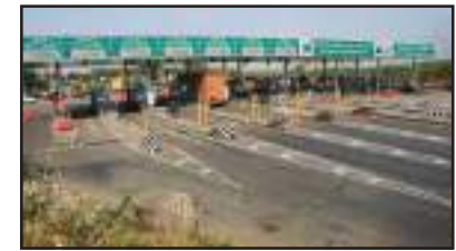
ଏହା ଜାତୀୟ ରାଜପଥ ଶୁଳ୍କ ସଂଶୋଧନ ନିୟମ, ୨୦୧୪ ଭାବରେ ଜଣାଶୁଣା। ନୂତନ ନିୟମ ଅନୁଯାୟୀ ଜାତୀୟ ରାଜପଥ ଏବଂ ଏକପ୍ରେସ୍‌ୱେରେ ୨୦ କିମି ଦୂରତା ଯାତ୍ରା କରିବା ପାଇଁ କୌଣସି ଶୁଳ୍କ ଆଦାୟ କରାଯିବ ନାହିଁ। ଏହି ଦୂରତା ଅତିକ୍ରମ କଲେ ଗାଡ଼ି ମାଲିକଙ୍କ ଯେତି ଦୂରତା ଯାତ୍ରା କରିଥିବେ ସେତିକି ଟୋଲ୍ ଟିକସ ଦେବେ। ଉଦାହରଣ ସ୍ୱରୂପ ଯଦି ଆପଣ ଜାତୀୟ ରାଜପଥରେ ୩ କିମି ଯାତ୍ରା କରିଛନ୍ତି ତେବେ ଆପଣ ୧୦ କିମି ଦୂରତା ପାଇଁ ଟୋଲ୍

ନ୍ୟୁଆଦିଲ୍ଲୀ : ଏକ ଗୁରୁତ୍ୱପୂର୍ଣ୍ଣ ଘଟଣାକ୍ରମେ କେନ୍ଦ୍ର ସରକାର ଟୋଲ୍ ନିୟମରେ ଏକ ବଡ଼ ପରିବର୍ତ୍ତନ କରିଛନ୍ତି। ଏହି ନିୟମାନୁଯାୟୀ, ବର୍ତ୍ତମାନ ଟୋଲ୍ ନେଇଗେସନ୍ ସାହେଲାଇର୍, ସିଷ୍ଟମ୍ (ଜିଏନ୍ଏସ୍ଏସ୍) ସଂସ୍କାରିତ ଘରୋଇ ଯାନଗୁଡ଼ିକୁ ୨୦ କିଲୋମିଟର ପରିଧି ପର୍ଯ୍ୟନ୍ତ ଯାତ୍ରାରେ ଟୋଲ୍ ଟିକସ ଦେବାକୁ ପଡ଼ିବନାହିଁ। ଜିଏନ୍ଏସ୍ଏସ୍ ଥିବା ବେସରକାରୀ ଯାନର ମାଲିକଙ୍କୁ କ୍ଷେତ୍ରରେ ରାଜପଥ ଏବଂ ଏକପ୍ରେସ୍‌ୱେ ଗୁଡ଼ିକରେ ଦୈନିକ ୨୦ କିମି ପର୍ଯ୍ୟନ୍ତ ଯାତ୍ରା ପାଇଁ ଟୋଲ୍ ଟିକସ ଲାଗୁ ହେବନାହିଁ। କେନ୍ଦ୍ର ସରକାର ପରିବହନ ଏବଂ ରାଜପଥ ମହାକାଶ ପକ୍ଷରୁ ମଙ୍ଗଳାବାର ଏ ସମ୍ପର୍କରେ ଏକ ବିଜ୍ଞପ୍ତି ଜାରି କରାଯାଇଛି। ଏଥିରେ ଜାତୀୟ ରାଜପଥ ଶୁଳ୍କ (ମୂଲ୍ୟ ନିର୍ଣ୍ଣୟ ଏବଂ ସଂଗ୍ରହ) ନିୟମ, ୨୦୦୮ରେ ସଂଶୋଧନ କରାଯାଇଛି। ବର୍ତ୍ତମାନ