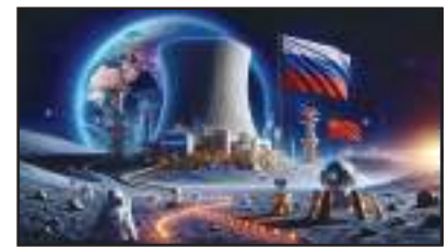
ଚନ୍ଦ୍ରପୁଷ୍ପରେ ପରମାଣୁ ଶକ୍ତି ପ୍ରକଳ୍ପ ନିର୍ମାଣ କାମ ଚାଲିଛି ବୋଲି ଯୋଷଣା କରିଛି ରଖି ମହାକାଶ ଉଦ୍ଦେଶ୍ୟା ସଂସ୍ଥା ରୋଷ୍ଟ୍ରୋସ୍ପାସ। ରଖି ଏବଂ ଚୀନ ମିଳିତ ଭାବେ ଏହି ଯୋଜନାରେ ସାମିଲ ହୋଇଥିବା କହିଛି। ଏହି ପ୍ରକଳ୍ପ ଦ୍ୱାରା ଭାରତର ଅନେକ ଲାଭ ହେବ। ଆସନ୍ତା ୨୦୪୦ ସୁଦ୍ଧା ଭାରତ ଚନ୍ଦ୍ରପୁଷ୍ପକୁ ମୂଳାଧାର ପଠାଇବାକୁ ଯୋଜନା କରିଛି। ଏହାଦ୍ୱାରା ଏହି ପ୍ରକଳ୍ପରୁ ସେଠାରେ ଆବଶ୍ୟକ ହେଉଥିବା ଶକ୍ତିର ଆବଶ୍ୟକତା ପୂରଣ କରିବ। ୨୦୧୧ରେ ରଖି ଏବଂ ଚୀନ ମିଳିତ ଭାବେ ଅନ୍ତରାଷ୍ଟ୍ରୀୟ ଚନ୍ଦ୍ର ଅନୁସଂଧାନ ଷ୍ଟେସନ ନିର୍ମାଣ କରିବାକୁ ଯୋଜନା କରିଛନ୍ତି। ଏହି ପ୍ରକଳ୍ପ ୨୦୧୫ରୁ ୨୦୪୫ ମଧ୍ୟରେ କେତେବେଳେ ବି ଆରମ୍ଭ ହେବ।

ସାମିଲ ହେବାକୁ ଲକ୍ଷ୍ୟ ପ୍ରକାଶ କରିଛି। ରଖି ସରକାରୀ ପରମାଣୁ ନିଗମ ରୋସାଟମ ଏହି ପ୍ରକଳ୍ପର ନେତୃତ୍ୱ ନେଇଛି। ଚନ୍ଦ୍ରପୁଷ୍ପରେ ହେବାକୁ ଥିବା ଏହି ପରମାଣୁ ଶକ୍ତି ପ୍ରକଳ୍ପରୁ ଅଧା ମେଗାୱାଟ ବିଦ୍ୟୁତ ଉତ୍ପାଦନ ହେବ। ଚନ୍ଦ୍ରପୁଷ୍ପରେ ହେବାକୁ ଥିବା ବେସକୁ ଏହି ପ୍ରକଳ୍ପରୁ ବିଦ୍ୟୁତ ସଂଯୋଗ କରାଯିବ। ଆସନ୍ତା ୨୦୧୬ ସୁଦ୍ଧା ପ୍ରସ୍ତୁତ ଚନ୍ଦ୍ରପୁଷ୍ପରେ ନିର୍ମାଣ ହେବାକୁ ଥିବା ଷ୍ଟେସନରେ ଆବଶ୍ୟକ ବିଦ୍ୟୁତ ଶକ୍ତି ପୂରଣ କରିବା। ରଖି, ଏବଂ ଚୀନ ମିଳିତ ଭାବେ ଏହି ଯୋଜନାରେ ସାମିଲ ହୋଇଥିବା କହିଛି। ଏହି ପ୍ରକଳ୍ପ ଦ୍ୱାରା ଭାରତର ଅନେକ ଲାଭ ହେବ। ଆସନ୍ତା ୨୦୪୦ ସୁଦ୍ଧା ଭାରତ ଚନ୍ଦ୍ରପୁଷ୍ପକୁ ମୂଳାଧାର ପଠାଇବାକୁ ଯୋଜନା କରିଛି। ଏହାଦ୍ୱାରା ଏହି ପ୍ରକଳ୍ପରୁ ସେଠାରେ ଆବଶ୍ୟକ ହେଉଥିବା ଶକ୍ତିର ଆବଶ୍ୟକତା ପୂରଣ କରିବ। ୨୦୧୧ରେ ରଖି ଏବଂ ଚୀନ ମିଳିତ ଭାବେ ଅନ୍ତରାଷ୍ଟ୍ରୀୟ ଚନ୍ଦ୍ର ଅନୁସଂଧାନ ଷ୍ଟେସନ ନିର୍ମାଣ କରିବାକୁ ଯୋଜନା କରିଛନ୍ତି। ଏହି ପ୍ରକଳ୍ପ ୨୦୧୫ରୁ ୨୦୪୫ ମଧ୍ୟରେ କେତେବେଳେ ବି ଆରମ୍ଭ ହେବ।