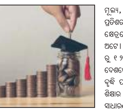
ଅଧିକ ଖର୍ଚ୍ଚ। ଯଦି ଆମେ ଖାଦ୍ୟ ମୁଦ୍ରାଂସୀତ ବିଷୟରେ ଆଲୋଚନା କରିବା ଅର୍ଥାତ୍ ଏହା ମଧ୍ୟ ୪ ପ୍ରତିଶତ ପରିସର ମଧ୍ୟରେ

ନ୍ୟୁଆଦିଲ୍ଲୀ : ଶିକ୍ଷା ଲୋକଙ୍କ ଜୀବନରେ ପରିବର୍ତ୍ତନ ଆଣିବା ବୋଲି କେହି ଅସ୍ୱୀକାର କରିପାରିବେ ନାହିଁ। ଏହାର କାରଣ ହେଉଛି ଭାରତର ମାନବ ଶିକ୍ଷା କ୍ଷେତ୍ରରେ ଭଲ ପୁଞ୍ଜି ବିନିଯୋଗ କରିବାକୁ ପଛପୁଅା ଦିଅନ୍ତି ନାହିଁ। ନିକଟରେ ଏକ ରିପୋର୍ଟରୁ ଜଣାପଡ଼ିଛି ଯେ ଦେଶରେ ଖାଦ୍ୟ ସାମଗ୍ରୀ ଖର୍ଚ୍ଚ ତୁଳନାରେ ଶିକ୍ଷା ଖର୍ଚ୍ଚ ଅଧିକ ହୋଇଛି। ଭାରତରେ ଖୁବ୍ତୁରା ମୁଦ୍ରାଂସୀତ ହାରକୁ ୪ ପ୍ରତିଶତରେ ବଜାୟ ରଖିବାକୁ ଲକ୍ଷ୍ୟ ଧାର୍ଯ୍ୟ କରାଯାଇଛି। କୁଳାଳ ମାସରେ ସାମଗ୍ରୀକ ମୁଦ୍ରାଂସୀତ ମଧ୍ୟରେ ଖାଦ୍ୟ ସାମଗ୍ରୀର