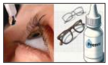
ମିଳିଥିବାବେଳେ କମ୍ପାନୀ ଏହାକୁ ବିନା ପରେ କେନ୍ଦ୍ର ସରକାର ଏକ କମ୍ପାନୀ ଉପରେ କାର୍ଯ୍ୟାନୁଷ୍ଠାନ ଗ୍ରହଣ କରିଛନ୍ତି। ଇଟିଡିଟି ଫାର୍ମା କମ୍ପାନୀ ଦ୍ୱାରା ଉତ୍ପାଦିତ ପ୍ରେସଭିୟୁ ଆଇଡ୍ରପ୍ ଉତ୍ପାଦନ ଏବଂ ବିକ୍ରୟ ଉପରେ ପ୍ରତିବନ୍ଧକ ଲଗାଯାଇଛି କେନ୍ଦ୍ର। କମ୍ପାନୀ ନିଜ ଉତ୍ପାଦନ ଅବଲମ୍ବନ କରିଥିବା ଜଣାପଡ଼ିଛି। ସୂଚନା ଅନୁସାରେ, ସିଡିଏସିଏ (କେନ୍ଦ୍ରୀୟ ଔଷଧ ମାନକ ନିୟନ୍ତ୍ରଣ ସଂଗଠନ) ପକ୍ଷରୁ ଏହି ଔଷଧର ଉତ୍ପାଦନ ଏବଂ ବିକ୍ରୟ ଅନୁମତିକୁ କେନ୍ଦ୍ର ସରକାର ରଦ୍ଦ କରିଦେଇଛନ୍ତି। ପରବର୍ତ୍ତୀ ନିର୍ଦ୍ଦେଶ ନ ମିଳିବା ଯାଏ କମ୍ପାନୀ ଏହି ଉତ୍ପାଦକୁ ବିକ୍ରି କରିପାରିବ ନାହିଁ ବୋଲି କୁହାଯାଇଛି।

ନ୍ୟୁଆଦିଲ୍ଲୀ : ଆଖିରେ ସମସ୍ୟା ହେଲେ ତାହାର ଆଇଡ୍ରପ୍ ପକାଇବାକୁ ପରାମର୍ଶ ଦେଇଥାଆନ୍ତି। ଏଥିପାଇଁ ତାହାର କେନ୍ଦ୍ର ପ୍ରେସଭିୟୁ ଆଇଡ୍ରପ୍ ଆବଶ୍ୟକତା ପଡ଼ିଥାଏ। କିନ୍ତୁ କିଛି କମ୍ପାନୀ ବିନା ପ୍ରେସଭିୟୁ ଆଇଡ୍ରପ୍ ଉପରେ ପ୍ରତିବନ୍ଧକ ଦେଇଥିବା ସାମ୍ବାଦିକ ଆସିଛି। ଏହା ଜଣାପଡ଼ିବା ପରେ କେନ୍ଦ୍ର ସରକାର ଏକ କମ୍ପାନୀ ଉପରେ କାର୍ଯ୍ୟାନୁଷ୍ଠାନ ଗ୍ରହଣ କରିଛନ୍ତି। ଇଟିଡିଟି ଫାର୍ମା କମ୍ପାନୀ ଦ୍ୱାରା ଉତ୍ପାଦିତ ପ୍ରେସଭିୟୁ ଆଇଡ୍ରପ୍ ଉତ୍ପାଦନ ଏବଂ ବିକ୍ରୟ ଉପରେ ପ୍ରତିବନ୍ଧକ ଲଗାଯାଇଛି କେନ୍ଦ୍ର। କମ୍ପାନୀ ନିଜ ଉତ୍ପାଦନ ଅବଲମ୍ବନ କରିଥିବା ଜଣାପଡ଼ିଛି। ସୂଚନା ଅନୁସାରେ, ସିଡିଏସିଏ (କେନ୍ଦ୍ରୀୟ ଔଷଧ ମାନକ ନିୟନ୍ତ୍ରଣ ସଂଗଠନ) ପକ୍ଷରୁ ଏହି ଔଷଧର ଉତ୍ପାଦନ ଏବଂ ବିକ୍ରୟ ଅନୁମତିକୁ କେନ୍ଦ୍ର ସରକାର ରଦ୍ଦ କରିଦେଇଛନ୍ତି। ପରବର୍ତ୍ତୀ ନିର୍ଦ୍ଦେଶ ନ ମିଳିବା ଯାଏ କମ୍ପାନୀ ଏହି ଉତ୍ପାଦକୁ ବିକ୍ରି କରିପାରିବ ନାହିଁ ବୋଲି କୁହାଯାଇଛି।