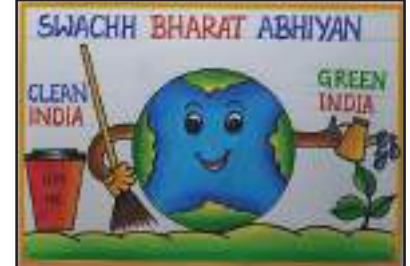
ଖୋଲା ଶୈତଳ ଭଳି କୁଆଖିସରେ ପରିବର୍ତ୍ତନ ଆସିଛି। କେବଳ ସେତିକି ନୁହେଁ, ପାଇପ୍ ଜଳ ଯୋଗାଣ ୧୬%ରୁ ବୃଦ୍ଧି ପାଇ ୭୮%ରେ ପହଞ୍ଚିଛି। ୧୧ କୋଟିରୁ ଅଧିକ ଘରକୁ ସୁଚ୍ଛ ରୋଷେଇ ବ୍ୟାସ୍ ସଂଯୋଗ ଦିଆଯାଇଛି। ଏହାଦ୍ୱାରା ସାମାଜିକ ଓ ସ୍ୱାସ୍ଥ୍ୟଗତ ପରିଣାମରେ ଉନ୍ନତି ଦେଖିବାକୁ ମିଳିଛି। ଅନୁପକ୍ଷରେ, ସୁପିଏ-୧ ସରକାରଙ୍କ ଅମଳରେ ଦେଶର କେତେକ ଜିଲ୍ଲାରେ ସୁଚ୍ଛତା ଓ ସ୍ୱାସ୍ଥ୍ୟପ୍ରଦ ଶୈତଳତା

ଯୋଗଦାନକୁ ଉଚ୍ଚ ପ୍ରଶଂସା କରାଯାଇଛି। ପ୍ରଧାନମନ୍ତ୍ରୀ ନରେନ୍ଦ୍ର ମୋଦୀ ଗବେଷଣାପତ୍ରର ପରିଣାମକୁ ନେଇ ସନ୍ତୋଷ ବ୍ୟକ୍ତ କରିଛନ୍ତି। ସାମାଜିକ ଗଣମାଧ୍ୟମ 'ଏବ'ରେ ଏ ସଂକ୍ରାନ୍ତ ଏକ ପୋଷ୍ଟ ଶେୟାର କରି ଶ୍ରୀ ମୋଦୀ କେଶ୍‌ଛନ୍ତି, 'ସୁଚ୍ଛ ଭାରତ ଭଳି ଅଭିଯାନର ପ୍ରଭାବ ଉଲ୍ଲେଖ କରୁଥିବା ଗବେଷଣାପତ୍ରର ଫଳାଫଳକୁ ଦେଖି ଆନନ୍ଦିତ। ଶୈତଳାୟର ଉପଯୁକ୍ତ ଉପଲବ୍ଧତା ନବଜାତ ଓ ଶିଶୁ ମୃତ୍ୟୁହାର ରୋକିବାରେ ଏକ ଗୁରୁତ୍ୱପୂର୍ଣ୍ଣ ଭୂମିକା ନିର୍ବାହ କରିଛି। ସୁଚ୍ଛ, ସୁରକ୍ଷିତ ପରିମଳ ଜନସ୍ୱାସ୍ଥ୍ୟ କ୍ଷେତ୍ରରେ ଯୁଗାନ୍ତକାରୀ ଉଲ୍ଲେଖ କରାଯାଇଛି। ଅନ୍ତର୍ଜାତୀୟ ଖାଦ୍ୟ ନୀତି ଗବେଷଣା ପ୍ରତିଷ୍ଠାନ, କାଲିଫର୍ଣ୍ଣିଆ ବିଶ୍ୱବିଦ୍ୟାଳୟ ଏବଂ ଓହ୍‌ୟୋ ସ୍ଟେଟ୍ ୟୁନିଭର୍ସିଟୀର ଗବେଷକଙ୍କ ଦ୍ୱାରା ପ୍ରସ୍ତୁତ ଏହି ଗବେଷଣା ପତ୍ରରେ ଶିଶୁ ମୃତ୍ୟୁ ହାର ରୋକିବାରେ ସୁଚ୍ଛ ଭାରତ ଅଭିଯାନର