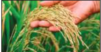
ନରେନ୍ଦ୍ର ମୋଦିଙ୍କ ଐତିହାସିକ ତୃତୀୟ ଚର୍ଚ୍ଚରେ କ୍ୟାବିନେଟ୍ ବୈଠକରେ ଅନେକ ମହତ୍ତ୍ୱପୂର୍ଣ୍ଣ ନିଷ୍ପତ୍ତି ନିଆଯାଇଛି। କ୍ୟାବିନେଟ୍‌ରେ ଚାଷୀଙ୍କ ସହ ଜଡ଼ିତ ମହତ୍ତ୍ୱପୂର୍ଣ୍ଣ ନିଷ୍ପତ୍ତି ନିଆଯାଇଛି। ଖରିଦ ରତ୍ନ ଆରମ୍ଭ ହେଉଛି। ତେଣୁ ୧୪ଟି ଖରିଦ ଫସଲର ଏମ୍‌ଏସ୍‌ସି ବୃଦ୍ଧି ପାଇଁ ଆଜି କ୍ୟାବିନେଟ୍ ନିଷ୍ପତ୍ତି ନେଇଛି। ୨୦୧୮ରେ କେନ୍ଦ୍ରୀୟ ସୂଚନା ଦେଇଛନ୍ତି। ସେ କହିଛନ୍ତି, ପ୍ରଧାନମନ୍ତ୍ରୀ

ନୂଆଦିଲ୍ଲୀ : କେନ୍ଦ୍ରରେ କ୍ଷମତାଧୀନ ନରେନ୍ଦ୍ର ମୋଦି ସରକାର ଧାନର ଏମ୍‌ଏସ୍‌ସି ସହାୟକ ମୂଲ୍ୟ ବା ଏମ୍‌ଏସ୍‌ସି ବୃଦ୍ଧି କରିଛନ୍ତି। ପୂର୍ବ ବର୍ଷର ଦର ଅପେକ୍ଷା କେନ୍ଦ୍ର ସରକାର ଧାନର ଏମ୍‌ଏସ୍‌ସିରେ ୧୧୭ ଟଙ୍କା ବୃଦ୍ଧି କରିଛନ୍ତି। ବର୍ଷିତ ଦର ପରେ ଚାଷୀମାନେ ନିଜର ଧାନକୁ କିଣିବା ପଛା ୨୩ ଶହ ଟଙ୍କାରେ ବିକ୍ରି କରିପାରିବେ। ଏନେଇ କେନ୍ଦ୍ର କ୍ୟାବିନେଟ୍ ନିଷ୍ପତ୍ତି ନେଇଛି। ଗତବର୍ଷ ଚାଷୀଙ୍କୁ ଧାନ ପାଇଁ ୨୧୮୩ ଟଙ୍କା ମିଳୁଥିଲା। ପ୍ରଧାନମନ୍ତ୍ରୀ ନରେନ୍ଦ୍ର ମୋଦିଙ୍କ ଅଧିକାରରେ ଏହି ବସ୍ତୁର କେନ୍ଦ୍ର କ୍ୟାବିନେଟ୍‌ରେ ଧାନ ସହ ୧୪ଟି ଖରିଦ ଫସଲର ଦର ବୃଦ୍ଧି ଉପରେ ମୋଦି ମାରିଥିବା କେନ୍ଦ୍ରମନ୍ତ୍ରୀ ଅଶ୍ୱିନୀ ଦେବିଙ୍କ ସୂଚନା ଦେଇଛନ୍ତି। ସେ କହିଛନ୍ତି, ପ୍ରଧାନମନ୍ତ୍ରୀ