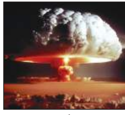
ଅସ୍ତ୍ର ଅଛି। ଗତ ଏକ ବର୍ଷ ମଧ୍ୟରେ ଭାରତ ୮ଟି ନୂତନ ପରମାଣୁ ଅସ୍ତ୍ର ତିଆରି କରିଥିବାବେଳେ ପାକିସ୍ତାନ କୌଣସି ନୂତନ ଆଣବିକ ବୋମା ତିଆରି

ଦିଲ୍ଲୀ ପ୍ରକାଶ କରିଛି। ତଥ୍ୟ ଅନୁସାରେ ସାରା ବିଶ୍ୱରେ କରାଯାଇ ଆଣବିକ ଅସ୍ତ୍ର ସଂଖ୍ୟା ବଢ଼ିବାରେ ଲାଗିଛି। ଆମେରିକା, ରୁଷ୍, ଫ୍ରାନ୍ସ, ଚୀନ, ଭାରତ ଏବଂ ପାକିସ୍ତାନ ସମେତ ନଅଟି ଆଣବିକ ସମ୍ପଦ ରାଷ୍ଟ୍ର ସେମାନଙ୍କର ଆଣବିକ ଅସ୍ତ୍ରସମୂହକୁ ଆଧୁନିକୀକରଣ କରି ରଖୁଛନ୍ତି। ସେମାନଙ୍କ ମଧ୍ୟରୁ ଅନେକ ୨୦୨୩ ମସିହାରେ ନୂତନ ଆଣବିକ କ୍ଷମତା ବିଶିଷ୍ଟ ଅସ୍ତ୍ର ପ୍ରଣାଳୀ ନିୟୋଜିତ କରିଛନ୍ତି। ଏସୋସିଏସିଆର ଆଇଏସ୍‌ଆଇ ଭାରତ ପାଖରେ ୨୦୨୩ରେ ୧୬୪ଟି ପରମାଣୁ ଅସ୍ତ୍ର ଥିଲା। ଏବେ ଏହି ସଂଖ୍ୟା ୧୭୨କୁ ବୃଦ୍ଧି ପାଇଛି। ସେପଟେ ପାକିସ୍ତାନ ପାଖରେ ୨୦୨୩ରୁ ୧୭୦ଟି ଆଣବିକ