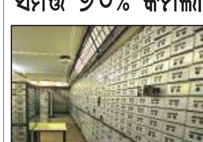
ନୂଆଦିଲ୍ଲୀ : ସ୍ୱିସ୍ ବ୍ୟାଙ୍କରେ ଥିବା ଭାରତୀୟଙ୍କ ସମ୍ପତ୍ତି ୨୦୨୩ରେ ୭୦% କମିଛି। ଏହା ୪ ବର୍ଷର ସର୍ବନିମ୍ନ ସ୍ତର ୧.୦୪ ବିଲିୟନ ସ୍ୱିସ୍ ଫ୍ରାଙ୍କ (୯ ହଜାର ୭୫୫ ୭୧ କୋଟି ଟଙ୍କା)ରେ ପହଞ୍ଚିଥିବା ସ୍ୱିଜରଲ୍ୟାଣ୍ଡ କେନ୍ଦ୍ରୀୟ ବ୍ୟାଙ୍କ ଗୁରୁତ୍ୱପୂର୍ଣ୍ଣ ତଥ୍ୟ ପ୍ରକାଶ କରିଛି। ୨୦୨୧ରେ ୧୪ ବର୍ଷର ଉଚ୍ଚତମ ସ୍ତର ୩.୮୩ ବିଲିୟନ ସ୍ୱିସ୍ ଫ୍ରାଙ୍କ (ସ୍ୱିଜରଲ୍ୟାଣ୍ଡ ମୁଦ୍ରା)ରେ ପହଞ୍ଚିବା ପରେ କ୍ରମାଗତ ଦ୍ୱିତୀୟ ବର୍ଷରେ ଭାରତୀୟଙ୍କ ସମ୍ପତ୍ତି ହ୍ରାସ ପାଇଛି। ତେବେ ମୁଖ୍ୟତଃ ବଣ୍ଟ, ସୁରକ୍ଷା ଓ ବିଭିନ୍ନ ଆର୍ଥିକ କାରଣରୁ ଭାରତୀୟ ସମ୍ପତ୍ତି କମିଛି। ସ୍ୱିସ୍ ବ୍ୟାଙ୍କର ବ୍ୟାଙ୍କ ଅଧିକାରୀଙ୍କ ଦ୍ୱାରା ଦିଆଯାଇଥିବା ସୂଚନାରୁ ଉପରୋକ୍ତ ତଥ୍ୟ ମିଳିଛି। ତେବେ ଏହି ତଥ୍ୟରେ ଭାରତୀୟଙ୍କ କଳାଧନ ସମ୍ପତ୍ତିରେ କୌଣସି ଉଲ୍ଲେଖ କରାଯାଇନାହିଁ। ୨୦୦୬ରେ ସ୍ୱିସ୍ ବ୍ୟାଙ୍କରେ ସର୍ବାଧିକ ୬.୫ ବିଲିୟନ ସ୍ୱିସ୍ ଫ୍ରାଙ୍କ ଜମା ଥିବା ବେଳେ ୨୦୧୧, ୨୦୧୩, ୨୦୧୭, ୨୦୨୦ ଓ ୨୦୨୧ ସହିତ କିଛି ବର୍ଷକୁ ଛାଡ଼ି ଏହା କ୍ରମାଗତ କମିବାରେ ଲାଗିଛି।