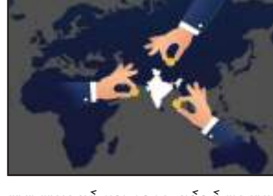
ଆଶା ଆହ୍ଲାଦପୂର୍ଣ୍ଣ ଥିବା ବେଳେ ପୂର୍ବବର୍ଷ ଅନୁଯାୟୀ ସାମାନ୍ୟ ବୃଦ୍ଧି ହୋଇପାରେ। ୨୦୨୩ରେ ଭାରତର ଏଫଡିଆଇ ପ୍ରବାହ ୧୦% ବୃଦ୍ଧି ହୋଇ ୪ ହଜାର ୯୫୫ କୋଟି ଡଲାରରେ ପହଞ୍ଚିଥିଲା। ପୂର୍ବ ବର୍ଷ ତୁଳନାରେ, ଭାରତ ୨୦୨୩ରେ ଟ୍ରିନିଡାଦ୍ ପ୍ରକଳ୍ପ

ନୂଆଦିଲ୍ଲୀ : ୨୦୨୩ରେ ବିଦେଶୀ ସ୍ତରରେ ପ୍ରତ୍ୟକ୍ଷ ବିଦେଶୀ ପୁଞ୍ଜି (ଏଫଡିଆଇ) ନିବେଶ ୨% କମିଥିବା ବେଳେ ଭାରତରେ ଏହା ୪୩% (୨ ହଜାର ୮ ଶହ କୋଟି ଡଲାର) କମିଥିବା ସଂଯୁକ୍ତ ରାଷ୍ଟ୍ର ବ୍ୟାପାର ଏବଂ ବିକାଶ ସମ୍ବଳନ (ୟୁଏନ୍‌ସିଏଟି) ରିପୋର୍ଟରେ ପ୍ରକାଶ ପାଇଛି। ଏଫଡିଆଇ କ୍ଷେତ୍ରରେ ୨୦୨୩ରେ ଭାରତ ଅଷ୍ଟମ ସ୍ଥାନରେ ଥିବା ବେଳେ ୨୦୨୩ରେ ୧୫୪ତମ ସ୍ଥାନକୁ ଖସିଛି। ତେବେ ଏଫଡିଆଇ ଟ୍ରିନିଡାଦ୍ ପ୍ରକଳ୍ପ ଓ ଆନ୍ତର୍ଜାତିକ ପ୍ରକଳ୍ପ ଆର୍ଥିକ କାରବାରରେ ଭଳି ପୂଜ୍ୟ ପ୍ରକାର ଏଫଡିଆଇରେ ଭାରତ ଶୀର୍ଷ ୫ ଦେଶ ମଧ୍ୟରେ ରହିଛି। ୨୦୨୪ରେ ଏଫଡିଆଇ ନିବେଶ