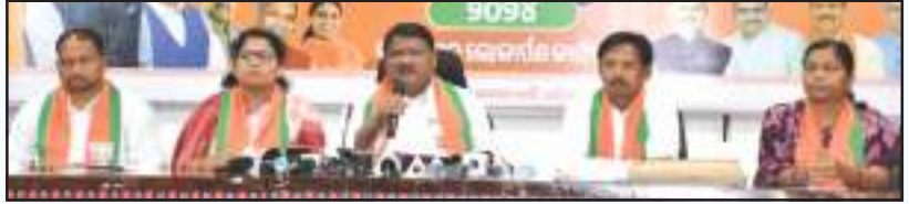
ସମ୍ବିଧାନର ସର୍ବୋଚ୍ଚ ସ୍ଥାନରେ ଦେଇ ରାଷ୍ଟ୍ରପତି କରାଇଛନ୍ତି । ସେତିକି ନୁହେଁ ବିର୍ସା ମୁଖାଙ୍କ କର୍ତ୍ତବ୍ୟ ୧୫ ନଭେମ୍ବରକୁ ଜନଜାତିର ଗୌରବ ଦିଏବ ରୂପେ ୨୦୨୧ ମସିହାଠାରୁ

ପ୍ରଥମରୁ ଜନଜାତି ବିକାଶ ମନ୍ତ୍ରାଳୟର ଦାୟିତ୍ୱ ପ୍ରଦାନ କରିଥିଲେ । ପରବର୍ତ୍ତୀ ସମୟରେ ମୋଦିଙ୍କ ସରକାରରେ ମଧ୍ୟ ଜୁଏଲ ଓରାମ ଏହି ମନ୍ତ୍ରାଳୟର ଦାୟିତ୍ୱ ଗ୍ରହଣ କରିଥିଲେ । ଏହା ସମସ୍ତ ଆଦିବାସୀ ସମାଜ ପାଇଁ ଗର୍ବ ଓ ଗୌରବର ବିଷୟ । ଯଶସ୍ୱୀ ପ୍ରଧାନମନ୍ତ୍ରୀ ନରେନ୍ଦ୍ର ମୋଦିଙ୍କା ଓଡ଼ିଶାର ଜଣେ ଆଦିବାସୀ ମହିଳା ଦୈପତ୍ୟା ମୁଖୁଙ୍କୁ