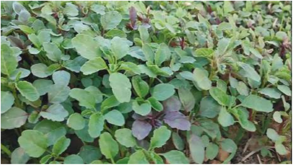
ବାର୍ଷିକ୍ୟରୁ ମଧ୍ୟ ରକ୍ଷା କରିଥାଏ । ସଜନା ଶାଗ ଖାଇବା ଦ୍ୱାରା ଉଚ୍ଚ ରକ୍ତଚାପ, ହୃଦରୋଗ, ଶ୍ୱାସକ୍ରିୟା ସମ୍ବନ୍ଧୀୟ ରୋଗ ତଥା ହଜମ ସମସ୍ୟାରୁ

ଉପକାରୀ । ଯଦି ଶରୀରରେ ଆଇରନ ଅଭାବରୁ ରକ୍ତହୀନତା ଦେଖାଦେଉଥାଏ, ତେବେ ପାଳଙ୍ଗ ଶାଗ ମହୋଷଧି ଭଳି କାମ କରେ । ଯେଉଁ ଲୋକଙ୍କ ଠାରେ ରକ୍ତ ଅଭାବ ସମସ୍ୟା ରହିଛି, ସେମାନେ ଦୈନିକ ପାଳଙ୍ଗ ଶାଗ ଖାଇବା ଉଚିତ୍ । ପାଳଙ୍ଗରେ ପ୍ରଚୁର ମାତ୍ରାରେ ଆଇରନ୍, ଥିବାରୁ ଏହା ହିମୋଗ୍ଲୋବିନ୍ ସ୍ତରକୁ ବୃଦ୍ଧି କରିବାରେ ସହାୟକ ହୋଇଥାଏ । ନିୟମିତ ପାଳଙ୍ଗ ଶାଗ ଖାଇବା ଦ୍ୱାରା ଅସ୍ଥି ଏବଂ କେଶ ସମସ୍ୟାରେ ଉପକାରୀ ହୋଇଥାଏ । ଆଳୁ, ବାଇଗଣ ସହ ପାଳଙ୍ଗ ଭଜା, ପାଳଙ୍ଗ ଡାଳମା, ପାଳଙ୍ଗ ସୁପ୍, ପାଳଙ୍ଗ ପରଗା ଏହିପରି ବିଭିନ୍ନ ବ୍ୟଞ୍ଜନ ପାଳଙ୍ଗ ଶାଗରେ ପ୍ରସ୍ତୁତ କରାଯାଏ । ନଦୀକୂଳ, ପୋଖରୀ କୂଳ ଓ ସନ୍ତସନ୍ତ କମିମାନଙ୍କରେ ସୁନୁସୁନିଆ ଶାଗ ହୋଇଥାଏ । ଏହି ଶାଗ ବେଶ୍ ସ୍ୱାଦିଷ୍ଟ । ସାଧାରଣତଃ ଅଧିକ ନିଦ ହେବା ପାଇଁ ଲୋକେ