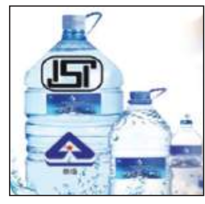
ବୋତଲ ଉପରେ ଏହି ନୂଆ ନିୟମର ପ୍ରଭାବ ଅଧିକ ପଡ଼ିବାର ସମ୍ଭାବନା ରହିଛି। କେନ୍ଦ୍ର ବାଣିଜ୍ୟ

ନୂଆଦିଲ୍ଲୀ : ବଜାରରେ ବିକ୍ରି ହେଉଥିବା ପାଣି ବୋତଲକୁ ନେଇ ଦେଶରେ ଖୁବ୍ ଲାଗୁ ହେବାକୁ ଯାଉଛି ନୂଆ ନିୟମ। ପାଣି ବୋତଲ ବିକ୍ରି କ୍ଷେତ୍ରରେ କେନ୍ଦ୍ର ସରକାର କଡ଼ା ଆଇନମୁଖ୍ୟ ଗ୍ରହଣ କରିବାକୁ ଯାଉଛନ୍ତି। ଏଣିକି ପାଣି ବୋତଲ ବିକ୍ରି କରିବାକୁ ହେଲେ କମ୍ପାନୀଗୁଡ଼ିକୁ ଭାରତୀୟ ମାନକ ବ୍ୟୁରୋ (ବିଆଇଏସ୍)ର ପ୍ରମାଣପତ୍ର ହାସଲ କରିବାକୁ ପଡ଼ିବ। ଏହି ନୂଆ ନିୟମକୁ ସରକାର ଆସନ୍ତା ଜୁନ ମାସରୁ ଲାଗୁ କରିବାକୁ ଯାଉଛନ୍ତି। ଯଦି ଏହା ହୁଏ, ତେବେ ବଜାରରେ ବିକ୍ରି ହେଉଥିବା ପାଣି ବୋତଲ ଗାଏବ ହୋଇଯିବ। ବିଶେଷକରି ବିଦେଶରୁ ଆମଦାନୀ ହେଉଥିବା