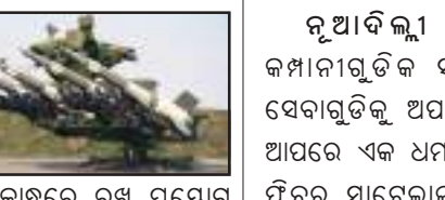
ନୂଆଦିଲ୍ଲୀ : ପଡ଼ୋଶୀ ରାଷ୍ଟ୍ରଠାରୁ ବହୁଳ ଭାରତ ଲାଗି ବିପଦ। ଶତ୍ରୁ ପକ୍ଷରୁ ଡ୍ରୋନ୍ ଓ ଲଠୁଆ ଯୁଦ୍ଧ ବିମାନର ମୁକାବିଲା ଲାଗି ଭାରତ ନିର୍ମାଣ କରୁଛି ସ୍ୱତନ୍ତ୍ର ଏୟାର ଡିଫେନ୍ସ ମିସାଇଲ ସିଷ୍ଟମ। କାନ୍ଧରେ ରଖି ପ୍ରୟୋଗ କରାଯାଇପାରୁଥିବା ଏହି ସିଷ୍ଟମ ଖୁବ୍ ଶୀଘ୍ର ଭାରତକୁ ଶକ୍ତିଶାଳୀ କରିବାର ସମ୍ଭାବନା ହେବ। ସାମାଜିକ ପାକିସ୍ତାନ ଓ ଚୀନ ପକ୍ଷରୁ ବିପଦ କ୍ରମାଗତ ଭାବେ ବଢ଼ିଥିବାବେଳେ ଏହାକୁ ପ୍ରତିହତ କରିବା ଲାଗି ସେନା ଓ ବାୟୁସେନାକୁ ୩୫୦ ଲକ୍ଷରୁ ୨ ହଜାର ମିସାଇଲ ପ୍ରଦାନ କରିବାକୁ ନିଆଯାଇଛି ପଦକ୍ଷେପ। ପ୍ରତିରକ୍ଷା ବିଭାଗ ସୂତ୍ର ଅନୁସାରେ ଏକ ଅତ୍ୟନ୍ତ ପ୍ରଭାବଶାଳୀ ଲେଜର ବିମ୍ ରାଇଡିଂ ଭେରି ସର୍ଭ ରେଞ୍ଜ ଏୟାର ଡିଫେନ୍ସ ସିଷ୍ଟମ ପ୍ରସ୍ତୁତ କରାଯାଉଛି। ଏକ ରାଷ୍ଟ୍ରୀୟ ସଂସ୍ଥା ଓ ଏକ ଯୋଦ୍ଧା ସଂସ୍ଥା ପକ୍ଷରୁ ଏହାର ନିର୍ମାଣ କରାଯାଉଛି। ସେହିପରି ପ୍ରତିରକ୍ଷା ଗବେଷଣା ଓ ବିକାଶ ସଂଗଠନ ବା ଡିଆରଡିଓ ଅନ୍ୟ ସଂସ୍ଥା ସହ ମିଶ୍ରି ପ୍ରସ୍ତୁତ କରୁଛି ସ୍ୱତନ୍ତ୍ର ପ୍ରକାର ମିସାଇଲ ଯାହାକି କାନ୍ଧରୁ ପ୍ରୟୋଗ କରାଯାଇପାରିବ। ଭାରତ ନିକଟରେ ରହିଥିବା ରୁଷିଆ ନିର୍ମିତ ଇଗଲ-୧ ଏମର ଏହା ବିକ୍ରୟ ହେବ।