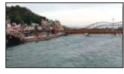
ପ୍ରକୃତିବିଦ୍ୟା ସଂସ୍ଥାନର ବିଶେଷଜ୍ଞମାନେ ନିକଟରେ କରିଥିବା ଏହି ଅଧ୍ୟୟନରୁ ଜଳବାୟୁ ପରିବର୍ତ୍ତନର କୁପରିଣାମକୁ ନେଇ ଚିନ୍ତା ପ୍ରକଟ କରିଛନ୍ତି। ଏ ସମ୍ପର୍କରେ ଅଧ୍ୟୟନ ଅଧିକ ହୋଇପାରିବ। ଗଙ୍ଗା ଏବଂ ସିନ୍ଧୁ ନଦୀ ଅବବାହିକାରେ ଆଗାମୀ କିଛି ବର୍ଷ ମଧ୍ୟରେ ଲୁପ୍ତ, ପ୍ରବଳ ବର୍ଷା, ବନ୍ୟା, ବାଟ୍ୟା ଭଳି ପ୍ରାକୃତିକ ବିପର୍ଯ୍ୟୟ ଆସିବ ବୋଲି ଆକଳନ କରାଯାଇଛି। ଭାରତୀୟ

ନୂଆଦିଲ୍ଲୀ : ବିଶ୍ୱ ତାପନ ଯୋଗୁ ଜଳବାୟୁ ପରିବର୍ତ୍ତନ ହେବାର ଲାଗିଛି, ଯାହାର ପ୍ରଭାବ ସାରା ବିଶ୍ୱ ଉପରେ ପଡ଼ୁଛି। କିନ୍ତୁ ଆଗାମୀ ଦଶନ୍ଧି ମଧ୍ୟରେ ଭାରତର ଅନେକ ଅଞ୍ଚଳ ଜଳବାୟୁ ପରିବର୍ତ୍ତନ ଯୋଗୁ ବିଶେଷ ପ୍ରଭାବିତ ହେବ ବୋଲି ପରିବେଶ ବିଜ୍ଞାନୀମାନେ ଗବେଷଣାରୁ ଜାଣିବାକୁ ପାଇଛନ୍ତି। ନିର୍ଦ୍ଦିଷ୍ଟ ଭାବେ କେତେକ ନଦୀ ଅବବାହିକାରେ ଥିବା ଅଞ୍ଚଳ ସବୁଠୁ ବେଶୀ ପ୍ରଭାବିତ ହେବ। ଏହି ନଦୀଗୁଡ଼ିକ ହେଲେ ଗଙ୍ଗା ଏବଂ ସିନ୍ଧୁ। ଏହା ଅବବାହିକାରେ ଆଗାମୀ କିଛି ବର୍ଷ ମଧ୍ୟରେ ଲୁପ୍ତ, ପ୍ରବଳ ବର୍ଷା, ବନ୍ୟା, ବାଟ୍ୟା ଭଳି ପ୍ରାକୃତିକ ବିପର୍ଯ୍ୟୟ ଆସିବ ବୋଲି ଆକଳନ କରାଯାଇଛି। ଭାରତୀୟ