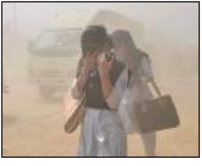
ପ୍ରାୟ ୨୦ ପ୍ରତିଶତ ଉଚ୍ଚ ବିପି, ଆଲକାହଲର ଏବଂ ପାର୍ଲିମେନ୍ଟର ରୋଗ ପରି ନ୍ୟୁରୋଡେଜେନେରେଟିଭ୍ ବ୍ୟାଧି ସହିତ ଜଡ଼ିତ ଥିଲା। ଅନୁସନ୍ଧାନକାରୀମାନେ ବିଶ୍ୱାସ କରନ୍ତି ଯେ ଜୀବାଣୁ ଜନ୍ମନ ଉପରେ ନିର୍ଭରଶୀଳ ଦେଶଗୁଡ଼ିକ ପ୍ରାୟ ୪.୬ ଲକ୍ଷ ଅର୍ଥାତ୍ ବାର୍ଷିକ ୦.୪୬ ନିୟୁତ ମୃତ୍ୟୁକୁ ସେମାନଙ୍କ ବ୍ୟବହାରକୁ ଏତାଇ ପାରିବେ। ଏଥିରେ, ସଂଯୁକ୍ତ ଆରବ ଏମିରାଟ୍‌ସରେ ରାଜିଥିବା ଉତ୍ତରୀୟ ଜଳବାୟୁ ପରିବର୍ତ୍ତନ ଆଲୋଚନା ଦ୍ୱାରା ଜୀବାଣୁ ଜନ୍ମନ ବନ୍ଦ କରିବାରେ ବହୁ ପରିମାଣରେ ପ୍ରଭାବଶାଳୀ ହୋଇପାରେ। ଏହିପରି ଉପାଦାନଗୁଡ଼ିକ ମିଳୁଛି ଯାହାଦ୍ୱାରା ଜୀବାଣୁ ଜନ୍ମନ ସର୍ବନିମ୍ନ ବ୍ୟବହୃତ ହୁଏ।

ନୂଆଦିଲ୍ଲୀ: ଦିନକୁ ଦିନ ଆମ ଚାରିପାଖରେ ବାୟୁ ଦୂଷିତ ହୋଇପାରୁଛି। ଦୂନିଆର ସମସ୍ତ ସଂସ୍କୃତ ସମସ୍ତ ଭାଗରେ ବାୟୁ ପ୍ରଦୂଷଣ ବୃଦ୍ଧି ପାଇଛି। ଏହି ସମୟରେ, ଏକ ରିପୋର୍ଟ ସାମାଜିକ ଆସିଛି ଯାହା ଭାରତୀୟ ବୈଜ୍ଞାନିକମାନଙ୍କର ନିଦ ହଜାଇ ଦେଇଛି। ଏହି ରିପୋର୍ଟ ଅନୁଯାୟୀ, ଭାରତରେ ପ୍ରତିବର୍ଷ ୨.୧୮ ନିୟୁତ ଲୋକଙ୍କର ମୃତ୍ୟୁ ହୋଇଥାଏ। ବିଏମ୍‌ଜେରେ ପ୍ରକାଶିତ ଏକ ରିପୋର୍ଟରୁ ଜଣାପଡ଼ିଛି ଯେ ବାୟୁ ପ୍ରଦୂଷଣ ଦ୍ୱାରା ଭାରତରେ ପ୍ରତିବର୍ଷ ୨.୧୮ ନିୟୁତ ଲୋକଙ୍କର ମୃତ୍ୟୁ ଘଟିଥାଏ, ଯାହା ଚୀନ ପରେ ଦ୍ୱିତୀୟ ସ୍ଥାନରେ ରହିଛି। ପ୍ରଦୂଷଣର କାରଣଗୁଡ଼ିକ ପ୍ରାୟ ସମସ୍ତ