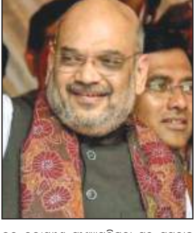
ଦୁଇ ତୃତୀୟାଂଶ ସଂଖ୍ୟାଗରିଷ୍ଠତା ସହ କ୍ଷମତାକୁ ଆସିବ ବୋଲି ଶ୍ରୀ ଶାହା ଦାବି କରିଛନ୍ତି। ୨୦୨୪ ଲୋକସଭା ନିର୍ବାଚନରେ ରାଜ୍ୟରେ ବିଜେପିର ପ୍ରଦର୍ଶନ ବିଧାନସଭା ନିର୍ବାଚନରେ

କୋଲକାତା: କେନ୍ଦ୍ର ସରକାର ନାଗରିକତା ସଂଶୋଧନ ଆଇନ (ସିଏଏ) ଲାଗୁ କରିବେ ଏବଂ ଏହାକୁ କେହି ରୋକିପାରିବେ ନାହିଁ ବୋଲି ଗୃହମନ୍ତ୍ରୀ ଅମିତ ଶାହ କୁହୁଥିବା ଦୃଷ୍ଟିକୋଣ ପ୍ରକାଶ କରିଛନ୍ତି। ଦକ୍ଷିଣ ଲୋକସଭା ନିର୍ବାଚନ ପ୍ରଚାର ଆୟୋଜିତ ଏକ ବିଶାଳ ରାଲିକୁ ସମ୍ବୋଧିତ କରି ଶାହା ଦୁଃଖକରଣ, ଅନୁପ୍ରବେଶ, ଦୁର୍ନୀତି ଏବଂ ରାଜନୈତିକ ହିଂସା ପ୍ରସଙ୍ଗରେ ପର୍ଯ୍ୟବସ୍ଥା ପ୍ରଶ୍ନାବଳୀ ମମତା ବାନାର୍ଜୀଙ୍କୁ ଚାହୁଁ ସମାଲୋଚନା କରିବା ସହ ଆଗାମୀ ବିଧାନସଭା ନିର୍ବାଚନରେ ତାଙ୍କ ସରକାରକୁ ହତାଳ ବିଜେପିକୁ ନିର୍ବାଚିତ କରିବାକୁ ଲୋକଙ୍କୁ ଅନୁରୋଧ କରିଛନ୍ତି। ରାଲିରେ ହୋଇଥିବା ବିପ୍ଳବ ସମାଗମକୁ ପ୍ରଶଂସା କରି ସେ କହିଛନ୍ତି ଯେ ଏହା ଲୋକଙ୍କ ମନୋଭାବକୁ ସୂଚାଉଛି ଏବଂ ୨୦୨୬ରେ ରାଜ୍ୟରେ ବିଜେପି