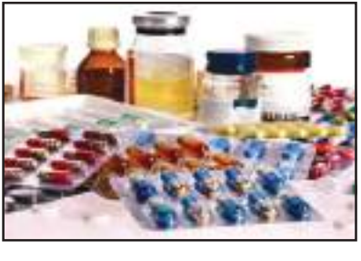
‘ମାନକ ଗୁଣବତ୍ତା’ ପୂରଣ କରୁ ନଥିବା ଜଣାପଡ଼ିଛି। ଗତ ବର୍ଷ ଡିସେମ୍ବରରୁ ଏହି ଯାଞ୍ଚ ଚାଲିଥିଲା। ସୂତ୍ରରୁ ପ୍ରକାଶ ଯେ ଏହି ସମସ୍ତ ଫାର୍ମାସୁଟିକାଲ୍ କମ୍ପାନୀ ମଧ୍ୟରୁ ୩୦ ପ୍ରତିଶତ ଫାର୍ମାସୁଟିକାଲ୍ କମ୍ପାନୀରୁ କମ୍ପାନୀ ବନ୍ଦ କରିବାକୁ ନିର୍ଦ୍ଦେଶ

ନୂଆଦିଲ୍ଲୀ: ଭାରତକୁ ବିଶ୍ୱର ଫାର୍ମାସିଆ କୁହାଯାଏ। କାରଣ ଏଠାରୁ ସମସ୍ତ ବିଶ୍ୱର ଔଷଧ ଯୋଗାଇ ଦିଆଯାଇଥାଏ। କାରଣ ଭାରତରେ ବଡ଼ ବଡ଼ ଫାର୍ମାସୁଟିକାଲ୍ କମ୍ପାନୀଗୁଡ଼ିକ କିଛି କିଛି ଉତ୍ପାଦନ କରୁଥିଲେ ମଧ୍ୟ ସମସ୍ତ ଔଷଧର ଉତ୍ପାଦନ ଓ ବଣ୍ଟନ ଉପରେ ଫାର୍ମାସୁଟିକାଲ୍ କମ୍ପାନୀଗୁଡ଼ିକ ପୂର୍ଣ୍ଣତଃ ନିର୍ଭର କରୁଥିଲେ। ଯାହାଦ୍ୱାରା ଦେଶରେ ଖରାପ ଉତ୍ପାଦନ ଓ ବଣ୍ଟନ ଉପରେ ନିର୍ଭର କରୁଥିବା ଦେଶ ତଥା ବିଦେଶରେ ବହୁତ ଚାହିଦା ରହିଛି। ତେଣୁ କେନ୍ଦ୍ର ସରକାର ବର୍ତ୍ତମାନ ଏହି କମ୍ପାନୀଗୁଡ଼ିକର ଔଷଧର ଗୁଣକୁ ନେଇ ଅତ୍ୟନ୍ତ ସତର୍କ ହୋଇଯାଇଛନ୍ତି। ନିକଟରେ ଗାନ୍ଧିଆରେ