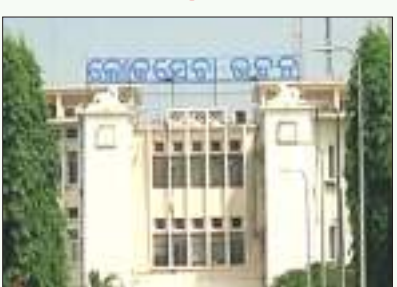
କ୍ୟାବିନେଟ୍ ନିଷ୍ପତ୍ତିକୁ ସ୍ଥଗିତ ରଖୁହେବ ?

ଭୁବନେଶ୍ୱର : ଆଦିବାସୀଙ୍କ ଜମି କେବଳ ଚାଷ କାର୍ଯ୍ୟ ବ୍ୟତୀତ ଅନ୍ୟ କୌଣସି ନିମନ୍ତେ ବ୍ୟାକ୍ ଅବା କୌଣସି ଆର୍ଥିକ ସଂସ୍ଥା ପାଖରେ ବନ୍ଧକ ରଖାଯାଇ ପାରିବ ନାହିଁ । ସିଦ୍ଧାନ୍ତ ଫାଇଦା ନେବାକୁ ଉଦ୍ୟମ କରିଛନ୍ତି ବୋଲି ଚର୍ଚ୍ଚା ଏରିଆରେ ଆଦିବାସୀଙ୍କ ଜମିକୁ ଅଣଅନୁସୂଚିତଙ୍କୁ ଦେବା ନିମନ୍ତେ ପୂର୍ବରୁ ଘାଟଣା ସୃଷ୍ଟି ହେଇଥିଲା । ସରକାର ଉଦ୍ୟମ କରି ଫେଲ୍ ମାରିଛନ୍ତି । ହେଲେ ଆଦିବାସୀଙ୍କ ଜମିକୁ ଅଣଅନୁସୂଚିତଙ୍କୁ ବିକ୍ରି ପାଇଁ ରାଜ୍ୟ କ୍ୟାବିନେଟ୍ ନିଷ୍ପତ୍ତି ନେଇ ଅନୁଆ