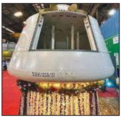
ଯେଉଁଥିରେ ମହିଳା ରୋବଟ୍ ମହାକାଶଗରୀ 'ବ୍ୟୋମପିତୃ' ରହିବେ। 'ଗଗନଯାନ' ପ୍ରକଳ୍ପରେ ମାନବ ଦଳକୁ ୪୦୦ କିଲୋମିଟର କକ୍ଷପଥକୁ ଉତ୍ତ୍ରେୟଣ କରି ଏବଂ ଭାରତୀୟ ସମଗ୍ର ଜନତାଙ୍କୁ ଉତ୍ତ୍ରେୟଣ କରିବା ସେମାନଙ୍କୁ ସୁରକ୍ଷିତ ଭାବେ ପୃଥିବୀକୁ ଫେରାଇ ଆଣି ମାନବ ମହାକାଶ ଯାତ୍ରା

'ଗଗନଯାନ' ଅଭିଯାନ ସମୟରେ ମହାକାଶଗରୀ ମାନଙ୍କୁ ମତ୍ୟୁଳ ମହାକାଶକୁ ନେଇ ଯିବ। ଏହି ପରୀକ୍ଷଣରେ ବାହ୍ୟ ମହାକାଶକୁ ଏକ କୁ ମତ୍ୟୁଳ ଉତ୍ତ୍ରେୟଣ କରିବା ଏବଂ ଏହାକୁ ପୃଥିବୀକୁ ଫେରାଇ ଆଣିବା ଏବଂ ବଜ୍ରୋପସାଗରରେ ଏହା ସ୍ୱର୍ଣ୍ଣ କରିବା ପରେ ଏହାକୁ ପୁନରୁଦ୍ଧ କରିବା ଅନ୍ତର୍ଭୁକ୍ତ। ଭାରତୀୟ ନୌସେନାର ଯବାନମାନେ ମତ୍ୟୁଳକୁ ଉଦ୍ଧାର କରିବା ପାଇଁ ମକ୍ ଅପରେସନ ଆରମ୍ଭ କରି ଯାରିଛନ୍ତି। ଏହି ପରୀକ୍ଷଣର ସଫଳତା ପ୍ରଥମ ମାନବବିହୀନ 'ଗଗନଯାନ' ଅଭିଯାନ ଏବଂ ଶେଷରେ ପୃଥିବୀର ନିମ୍ନ କକ୍ଷ ପଥରେ ମହାକାଶକୁ ମାନବଯୁକ୍ତ ଅଭିଯାନ ପାଇଁ ମଞ୍ଚ ପ୍ରସ୍ତୁତ କରିବ ବୋଲି ମନ୍ତ୍ରୀ ସୂଚନା ଦେଇଛନ୍ତି। ତୃତୀୟ ମାନବଯୁକ୍ତ 'ଗଗନଯାନ' ଅଭିଯାନ ପୂର୍ବରୁ ଆସନ୍ତା ବର୍ଷ ଏକ ପରୀକ୍ଷଣ ଉଡ଼ାଣ ହେବ,