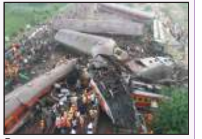
ଗିରଫ ଗା ରେଳ ଥିବାବେଳେ ମାଲଭାନ୍ କେନ୍ଦ୍ର କରାଯାଇଥିଲା। ସିବିଆଇ କର୍ମଚାରୀଙ୍କୁ ସମନ ଦିଆଯାଇଛି।

ଭୁବନେଶ୍ୱର : ବାହାନଗା ଟ୍ରେନ୍ ଗ୍ରାଜେଟିରେ ଆଉ ୧୦ ଜଣ ଭେଳବାଲ କର୍ମଚାରୀଙ୍କୁ ସିବିଆଇରେ ସମନ ଦିଆଯାଇଛି। ଶୁକ୍ରବାର ସେମାନେ ସିବିଆଇରେ ହାଜର ହୋଇ ନିଜର ପକ୍ଷ ରଖିବେ।