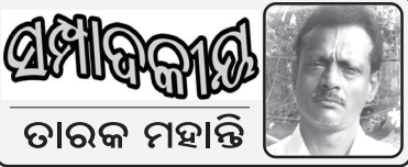
ପ୍ରମୋଦ କୁମାର ତାରକ ମହାନ୍ତି